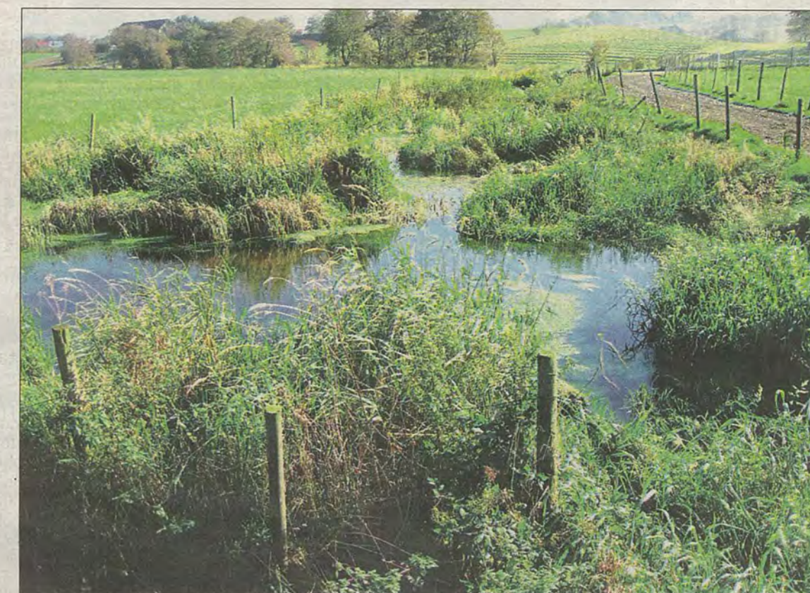
Reinseparkar for å fange opp fosfor før det kjem ut i vatna, er eitt av tiltaka som blir vurdert.