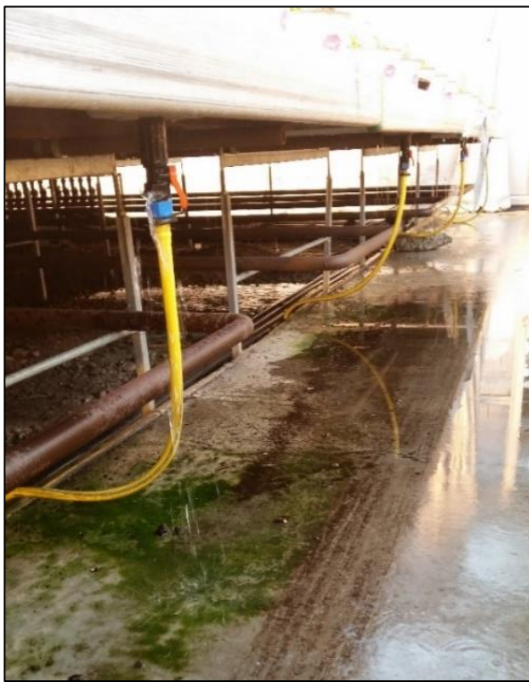
Venstre; Lekkasje i slangekobling.

Lekkasjer i bord kan komme fra tilkobling av slanger eller sprekker i bordplatene. Skjøtene i bordplaten kan gå opp i limingen, i tillegg blir platen i bordplatene sprø over tid, og en må reparere sprekker eller skifte bordplater som er skadd. Se etter våte områder under bord eller i gangen etter vanning, for å finne lekkasjer.