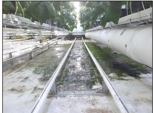
Vannsøl under renner i agurkproduksjon; et levested for grønnalger og skadegjørere.

Vannsøl gir gode vekstbetingelser for grønnalger, ugress og ulike skadegjørere, som vannfluer og hærmygg. Med et rent og velfungerende vanningsystem vil også disse problemene reduseres.