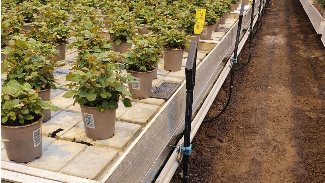
Mobilbord der vanningshodene er snudd til side.

I mobilbordsystem kan man ha kran på vanningsystemet til hvert bord så det kan stenges når plassen er tom eller bordet ikke trenger vann. Dette kan bli en dyr installasjon og gi problemer med trykket i resten av vanning systemet.