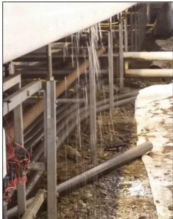
Høyre; Sprekker i bordplate.

En mulig lekkasje i et mobilbordsystem kan oppstå når det ikke står et bord på en bordplass, men det allikevel vannes her. Det samme gjelder hvis ikke alle bord på en vanningskurs har behov for vann samtidig. I slike tilfeller snus ofte vanningshodet vekk fra bordet og vannet ender på gulvet i stedet for i resirkuleringsanlegget.