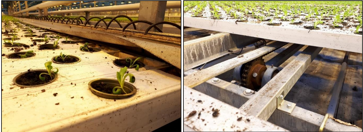
Venstre: Renner med småplanter av salat vannes fra siden med en slange for hver renne. Høyre: Rennene beveges automatisk fra den ene enden av huset hvor de plantes, til den andre der de høstes.