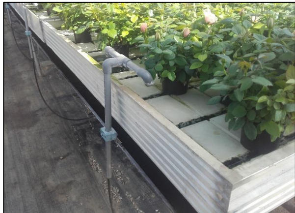
Mobilbord med oppsamling i renne under bordet.

I system med mobilbord flyttes bordene fra plass til plass i huset. På hver «bordplass» er det installert fast vanningspunkt. Vannet dreneres ut i en fast langsgående renne.