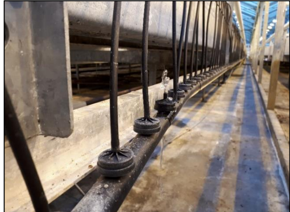
Venstre. Vannslange som har kommet skjevt på rennen. Her er det satt opp oppsamlingsrenne så vannet fra den skjeve slangen samles opp og ledes tilbake i retursystemet. Høyre. Lekkasje i festet for vanningslangen.

Ved bruk av renner eller drypp skjer det også at slangene kommer skjevt på vanningspunktet og renner utenfor. Da dette ofte vil medføre at plantene tørker ut, er gartnerne ofte ekstra oppmerksomme på å rette opp dette. Ikke alle har system for å samle opp.