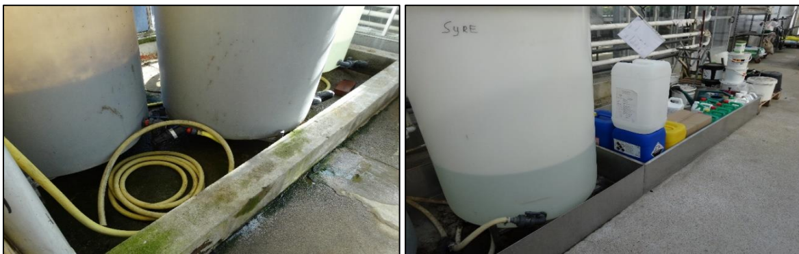
Oppkant rundt stamløsningskar og oppbevaring av flytende gjødsel for å hindre avrenning ved lekkasje.

Gjødselsystemet kan inneholde stamløsningskar til gjødsel, returkar og rensesystem til returvann. I tillegg til karene er det mange rør og ventiler der det kan oppstå lekkasjer. Et enkelt forebyggende tiltak for å forhindre avrenning av konsentrert flytende gjødsel, er å lage en oppkant rundt gjødselblander, stamløsningskar og oppbevaringsplassen for flytende gjødsel. Oppkanten bør være så høy at volumet innenfor kanten kan romme innholdet av den største beholderen ved en eventuell lekkasje.