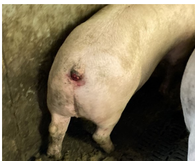
Hele halen avbitt