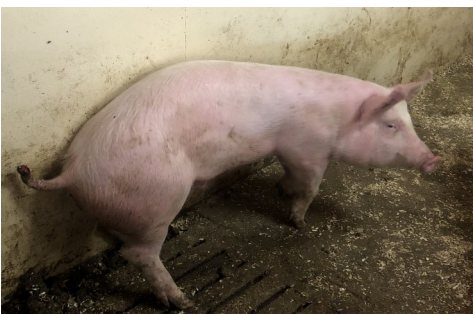
Gris med flere diagnoser