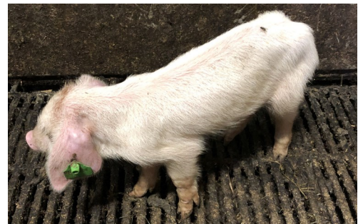
Tynne og stusselige