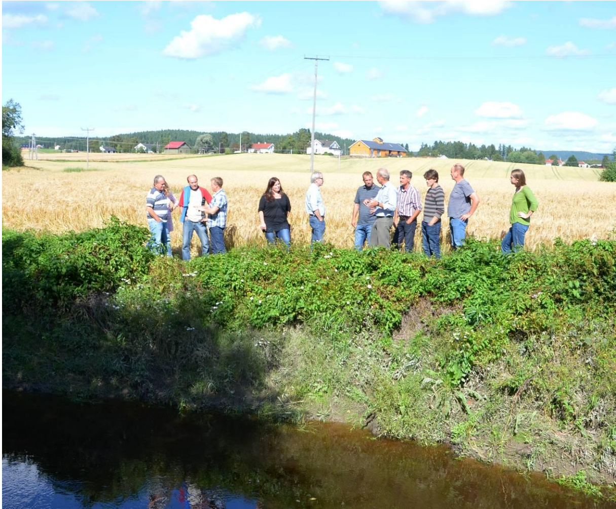
Diskusjon av kantsoner mot vassdrag.

statlege midlar til programmet. Det vart av Fylkesmannen teke initiativ for å finne regional finansiering både i 2011 og 2012.