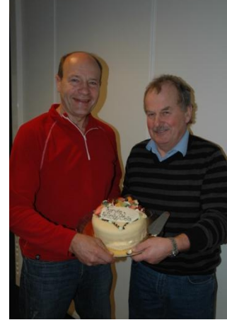
Glade prosjektleiarar feirar godt tursti-resultat .

Sola kommune ba om at prosjektleiarane kunne leggja grunnlaget for ein turvei mellom Hellestø og Sele. Arbeidet er nå avslutta og kommunen har dermed fått det grunnlaget dei ynskte for å kunna prioritera bygging av denne viktige turveien på 2,2 km i grensa mellom landbruk og verna friområde. Me vil takka alle partane for godt samarbeid. Me hadde presentasjon av planane med presse i februar som vart godt dekkja.