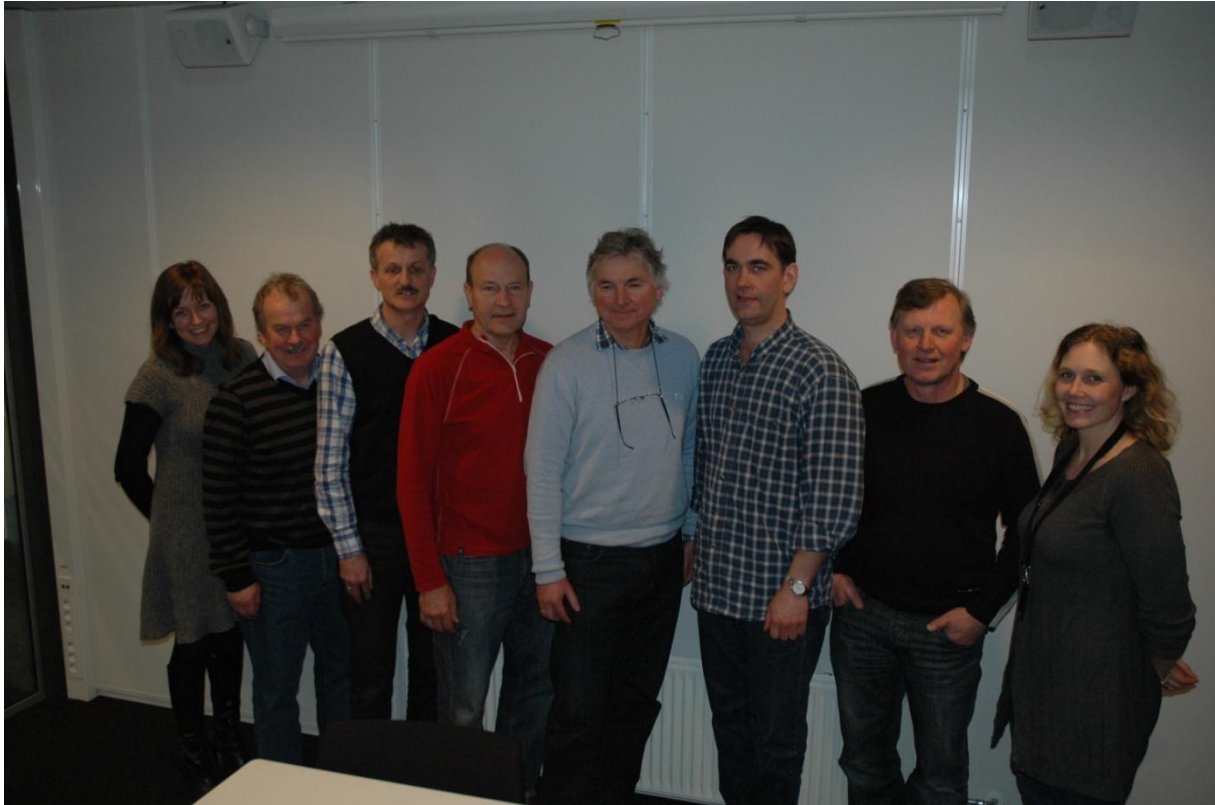
Styringsgruppa på møte 26. februar 2012