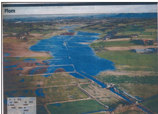
Omtale i Stavanger Aftenblad om flom i Skas Heigre

Miljøavtalane er eit viktig samarbeidsprosjekt mellom miljø og landbruk i Skas Heigre i Sandnes, Klepp og Sola. Det vart starta i 2010 som ei treårig satsing. I 2012 vart det vedtatt å forlengje satsinga med halverte tilskotssatsar. Bøndene har inngått avtale med landbruksforvaltninga om gjødsling, ugjødsla randsoner og gjødselprøvetaking. Underteikna avtale gir rett til å søkje om tilskot frå Regionalt miljøprogram. Søknad om RMP viser at 70 bønder har søkt tilskott for til saman 20 097 daa fulldyrka og 1 944 daa beite i 2012. I nedbørsfeltet til Skas Heigre er det totalt ca 24 000 daa jordbruksareal. Erfaringane til nå er gode. Det er betydeleg reduksjon i fosfortilførslane frå jordbruket samanlikna med vanlig gjødslingspraksis frå før 2010.