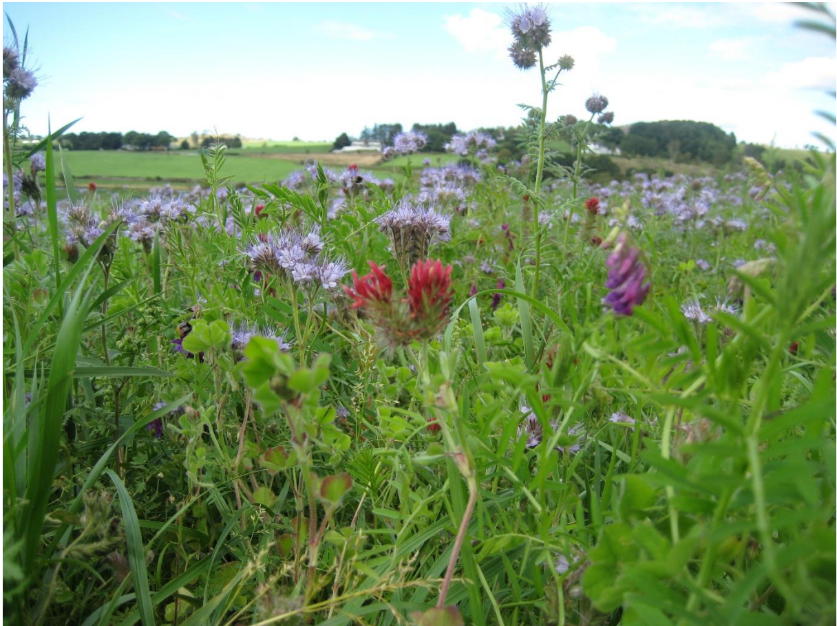
Figur 2: Blomar frå ein pollinator-vennleg sone.