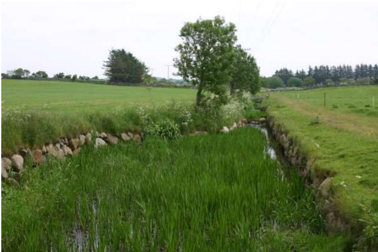
Reinsepark

Diffus næringsavrenning frå jordbruket er ei kjelde til eutrofiering av vassdrag. Føremålet med tiltaka er å redusere tapet av næringsstoff og plantevernmiddel. Vassdrag som etter Vassdirektivet si klassifisering er sterkt påverka av jordbruk, og som har dårleg vasskvalitet er prioritert.