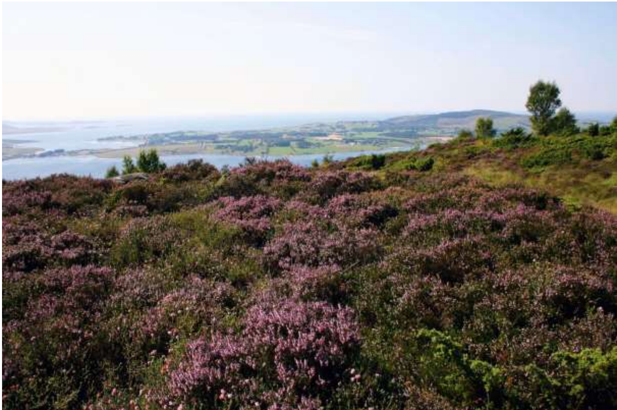
Selsfjellet mot Mosterøy

Jordbruket er viktig for å ta vare på biologisk mangfald. Mange artars levested er knytt opp til ulike driftsmetodar i jordbruket. Med naturmangfaldlova blei omsynet til biologisk mangfald forsterka. I Regionalt miljøprogram er det viktig å understreke at tilskot skal gå til føretak som har aktiv skjøtsel av definerte naturverdiar, og skal ikkje sjåast på som ei erstatningsordning for ulike lovpålegg etter naturmangfaldlova.