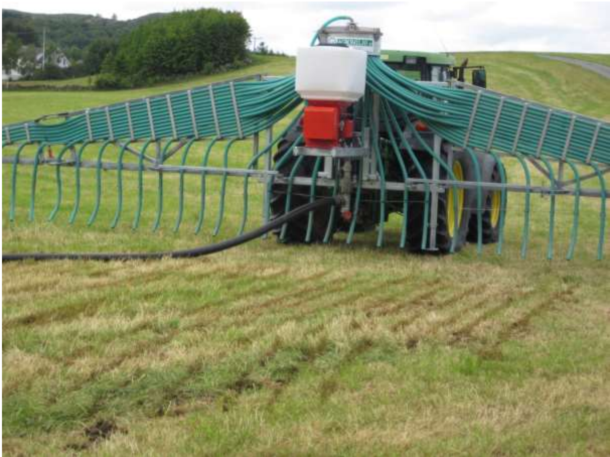
Spreieutstyr for nedlegging av husdyrgjødsel med slangetilkopling til gjødsellager

Husdyrgjødsel er ein verdifull ressurs i jordbruket. Spreiemetodar som gjer at gjødsla raskare kjem i kontakt med jord førar til mindre tap av næringsstoffar. Metodane gir mindre tap av ammoniakk til luft, mindre næringsavrenning til vassdrag og mindre lukt i samband med spreieinga. Den nasjonale pilotordninga med tilskot til miljøvenleg spreieing av husdyrgjødsel vart avslutta i 2012, og frå 2013 er tilskot til miljøvenlege metodar tatt inn i regionalt miljøprogram.