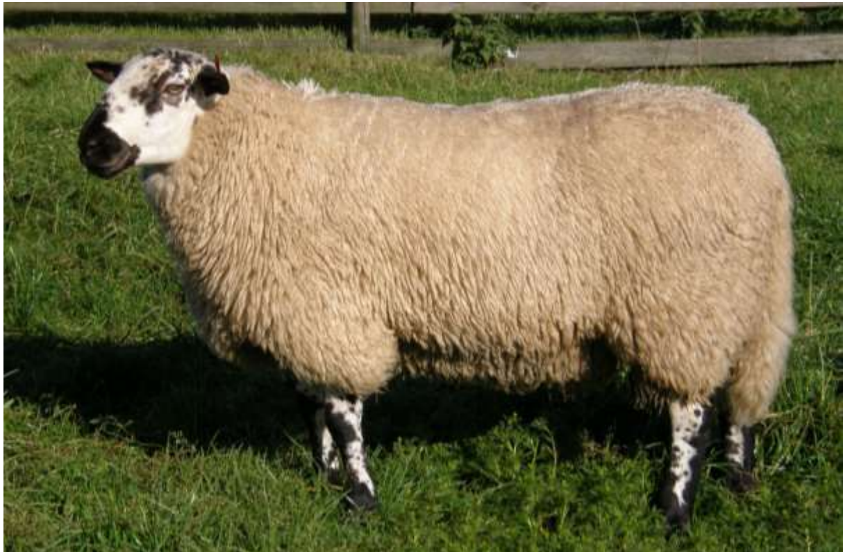
Fuglestadbrogete sau er ein av rasane med spesiell utbreiing i Rogaland

Ein bevaringsverdig rase er her definert som ein nasjonal rase med så få individ at dei er kritisk trua. Det blir gitt tilskot til raser som har sitt opphav frå Vestlandet, eller har ein spesiell utbreiing her. Rasen må vere på Norsk genressurscenter sin oversikt over bevaringsverdige husdyrrasar.