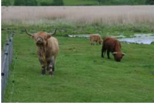
Skotsk høylandsfe

Tilskotet kan bli gitt til ammegeit og storfe av ekstensiv rase som beitar på utmarksbeite. I beitetida skal grovfôropptaket i all vesentlig grad vere gjennom beiting.