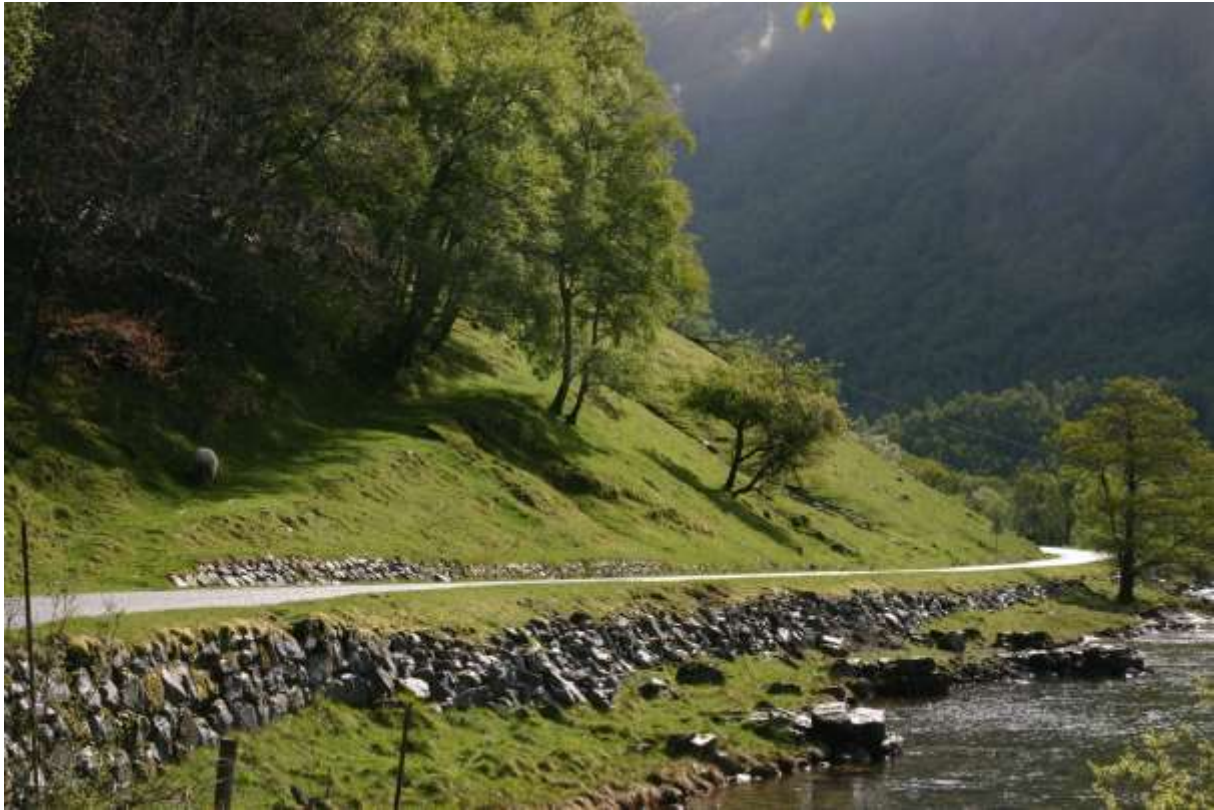
Bratt areal i Espedalen

Fleire stader i Rogaland er gjengroing av kulturlandskapet eit aukande problem. Det opne og varierte landskapet er svært viktig for trivsel og busetnad. Reiselivet tener også på opne og vakre kulturlandskap. Omstillinga i landbruket er stor. Tempoet i gjengroinga er så stor at det vil vere umogleg å stoppe utviklinga alle stader. I Regionalt miljøprogram har vi derfor valt ut einskilde stader der vi meiner det er spesielt viktig å hindre gjengroinga.