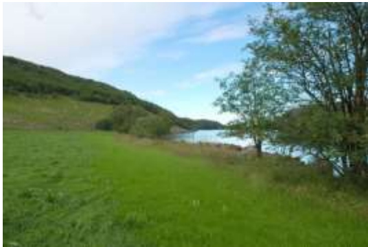
Ugjødsla randsone i eng