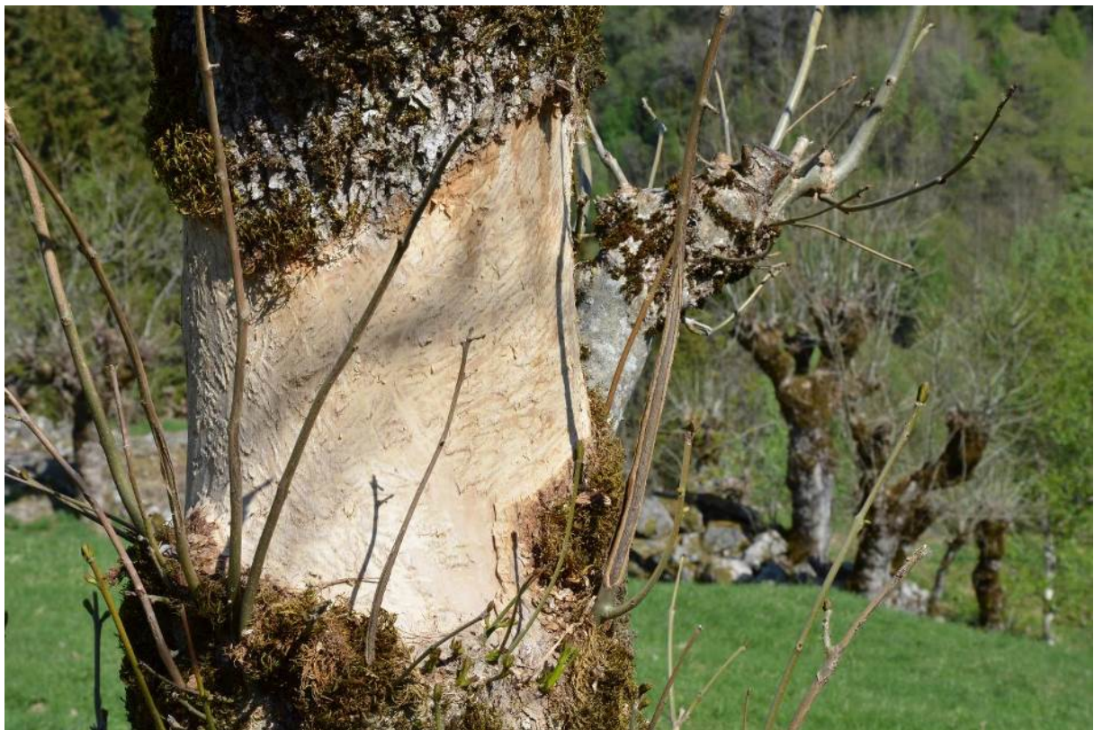
Figur 14. Hjortegnag på styvingstre. Dette treet er ringborka av hjorten og vil døy i løpet av eit par år.

Mykje haustingsskog ligg i vanskeleg og lite tilgjengeleg terreng og har såleis ikkje vore særleg utsett for oppdyrking, utbygging eller vegprosjekt. Skogbruk med treslagskifte og tilplanting av bartre, ofte framande treslag, er derimot eit sterkt trugsmål mot gamal haustingsskog. I somme område kjem framande treslag som platanlønn inn og fortrenger heimlege lauvtreslag. For alm og ask kan i tillegg soppsjukdomar bli eit alvorleg trugsmål framover. Både askeskotsjuka og almesjuka breier om seg, askeskotsjuka aller mest. Klimaendringar i retning av eit mildare klima er blant årsakene til dette.