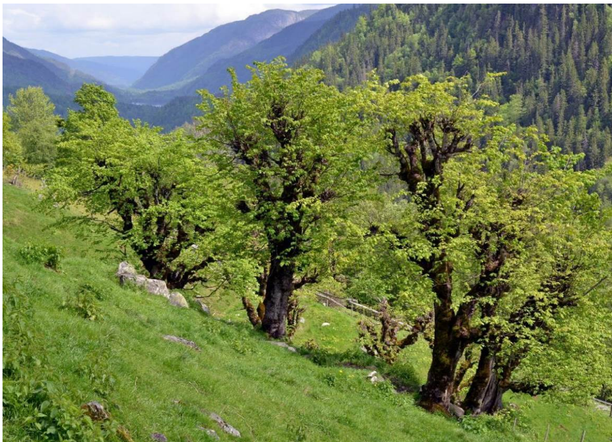
Figur 5. Hagemark med styvingstre hovudsakleg av alm på Myljom-To i Hjartdal kommune, Telemark. Dette har tidlegare vore lauveng, der ein både slo enga og lauva trea. I vår tid er bakkane berre blitt beita. Slåtten har teke slutt, men trea blir enno lauva.

Lauveng er lysopen, tresett slåttemark forma ved hausting av fôr i både feltsjiktet (slått og beiting) og tresjiktet (vanlegvis styving). Feltsjiktet har meir enn 50 % dekning. Tresjiktet består av styva eller stubbelauva gamle lauv- og edellauvtre som alm, ask og bjørk, med tettleik 2-5 gamle tre per dekar. Lauveng kan også ha innslag av hassel.