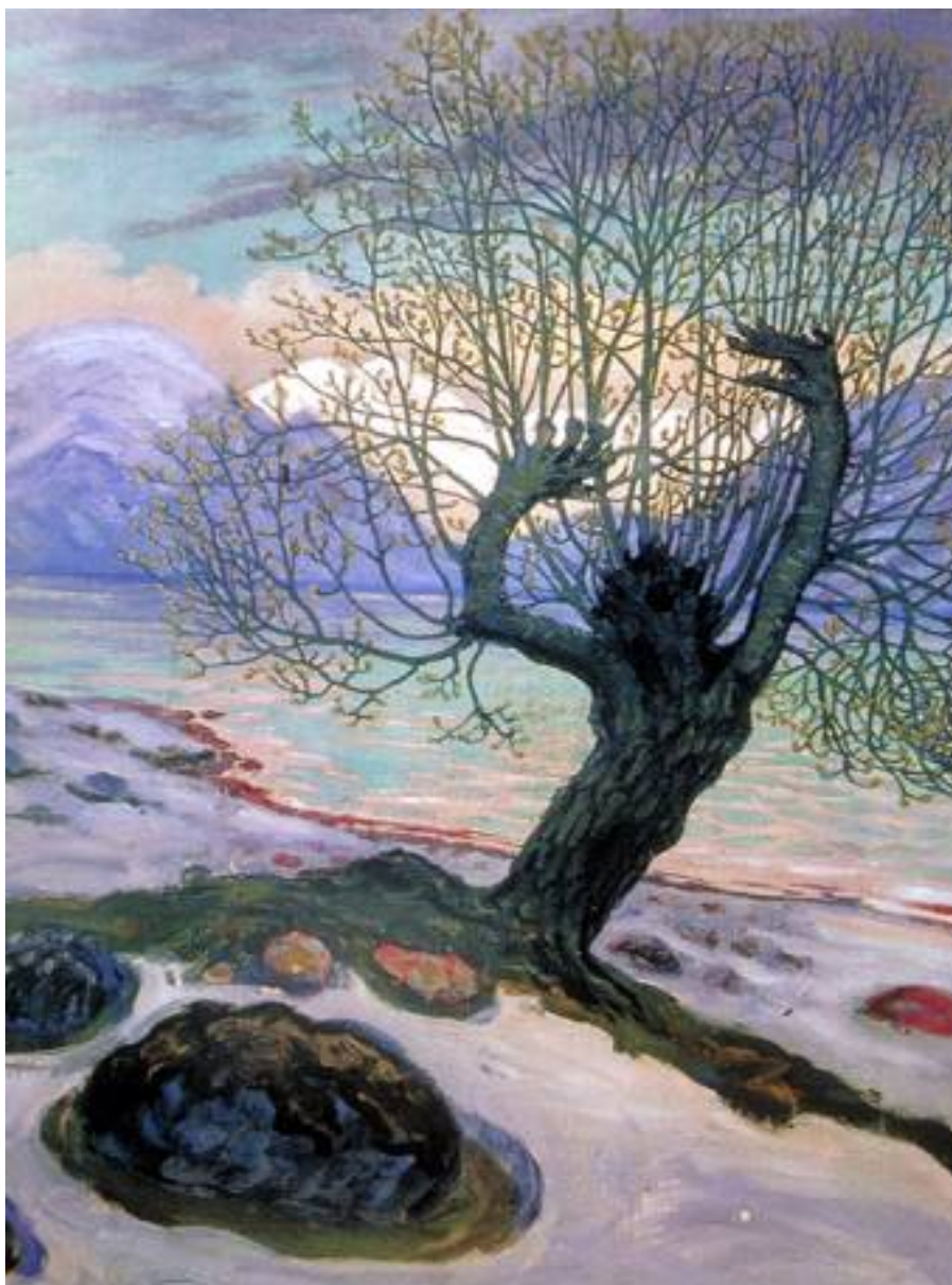
Figur 1. «Marzmorgen»/«Seljekall» av Nikolai Astrup. Den spesielle biologien gjev styvingstrea den særeigne utsjånaden, med tjukke «kroppar», krokete «armar» og små, tette kroner. Formene har gjeve assosiasjonar på fleire hald opp gjennom tidene, både i folkeeventyra og i kunsten.

I tillegg til å vera ein viktig del av kulturarven vår, ber haustingsskogen på eit rikt biologisk mangfald knytt til gamle tre. Sist, men ikkje minst, har lauvtre som har blitt hausta over generasjonar fått noko eventyraktig over seg. Det er ikkje mange stader natur- og kulturarven går så hand i hand som nettopp i haustingsskogen!