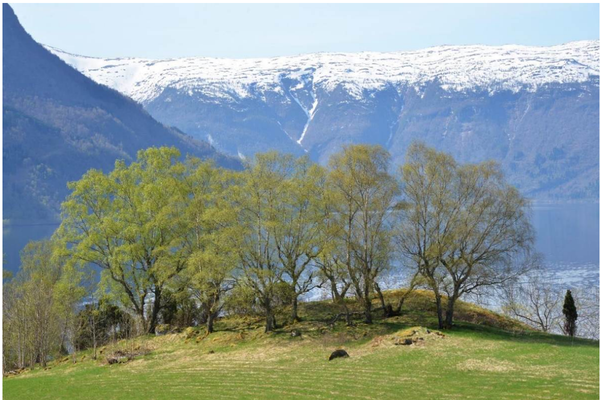
Figur 3. Hagemark med styvingstre av bjørk på Kroken, Luster kommune i Sogn og Fjordane. Styvingstre av bjørk får ei særeigen kandelaber-aktig form. Det er ei tid sidan desse trea har vore i hevd.