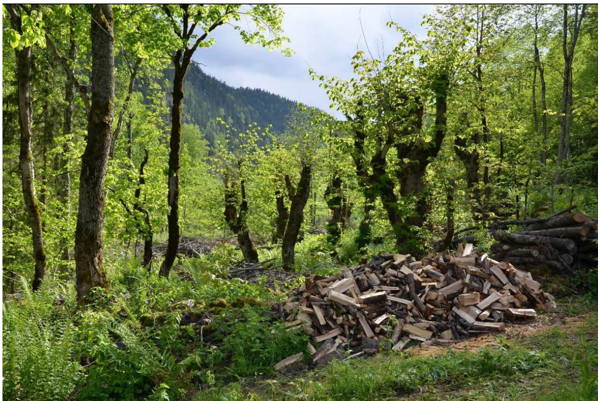
Figur 17. Restaurering av haustingsskog av alm på Ambjørndalen, Hjartdal kommune i Telemark. Ein starta i jordekantar der det var lysope og utvida etter kvart. Det er mykje arbeid med ved og kvist. Kvisthaugar kan ikkje brennast nær trea.