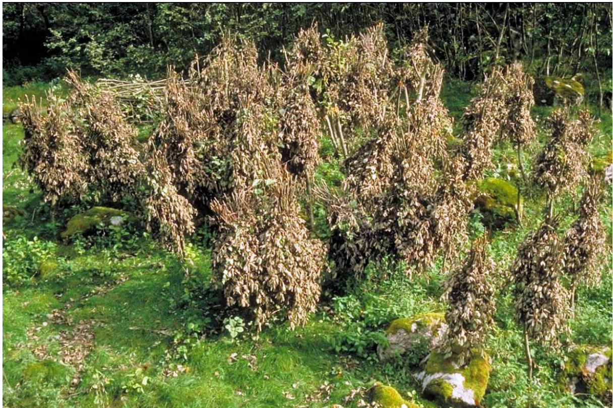
Figur 9. Nyleg lauva gråor i Lærdal, Sogn og Fjordane.

Selje og hassel har også blitt stubbehausta. For selja sin del blei det gjort mest for fôret, men virket kunne også nyttast til flettverk og anna. Hassel stubbehausta dei fyrst og fremst for å få trevirke til ulike føremål (tønneband, korgfletting, fiskestenger, staurar m.m.), samt brennved. Hassellauvet blei til dels også nytta, mellom anna til grisefôr. Nøttene kom til nytte i eige hushald og somme stader var nøtter eksportvare.