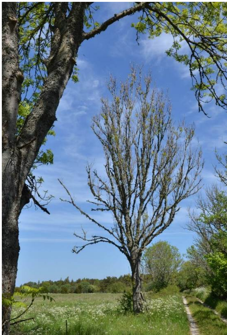
Figur 15. Ask med askeskotsjuka.

Det er med andre ord mange fysiske årsaker til at haustingsskog er ein truga naturtype. I tillegg kjem generell mangel på kjennskap til det eldre haustingsskogen og kva som skal til for å halde dei ulike skjøtselsavhengige naturtypene ved like eller restaurere dei fram att.