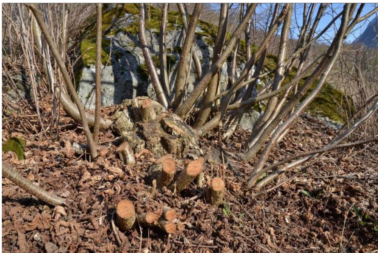
Figur 11. Uthogging av hasselstakar. Dei gamle stubbane og røtene kan blir sær gamle.

Verdien av lauvtre som fôrressurs kjem godt fram i ulike historiske samanhengar, mellom anna ved verdsetjing av eigedomar og i samband med arv. Det finst mange konkrete døme på at styvingstre og lauvingsrettar blei omsette for seg sjølve, uavhengig av grunneigedomen elles. Alm var særleg verdsett i slike samanhengar, både på grunn av fôrverdien og almeborken, som kunne nyttast til matmjøl i uår og «borkebrødstider».