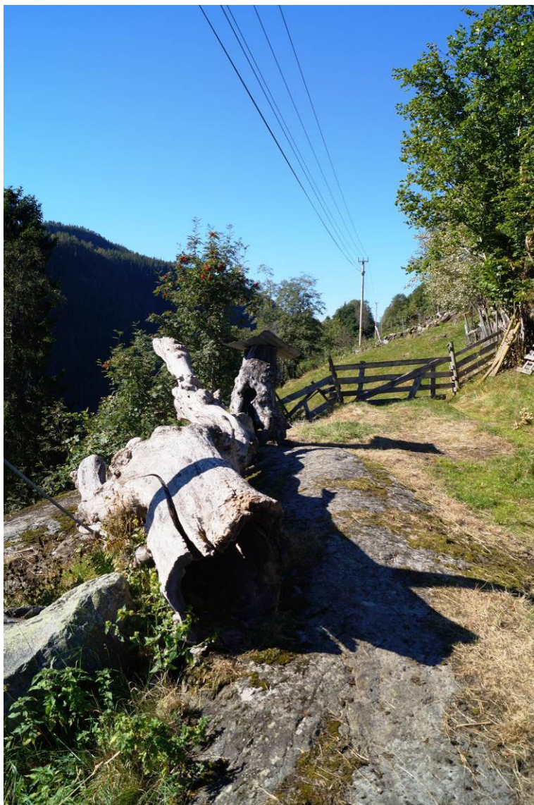
Figur 18. Gamle stammerestar som er spart og lagt i nærleiken av dei levande styvingstrea i lauvingslia på Myljom-To i Hjartdal, Telemark. Dei er flotte å sjå på, og er i tillegg «artshotell» for artar knytt til gamal og daut ved, til dømes mange sjeldne lavartar.