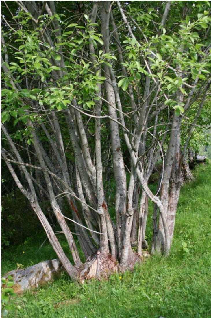
Figur 10. Stubbehausta selje i Skardvika i Hamarøy kommune i Nordland.

Ei sams nemning for denne type haustingsområde er stubbeskotskogar . Dette er ikkje ei eiga naturtype i seg sjølv, men kan akkurat som med styvingstrea finnast som innslag i ulike naturtypar innanfor kulturlandskap (t.d. haustingsskog) og skog (t.d. gråor-heggeskog, fjellbjørkeskog).