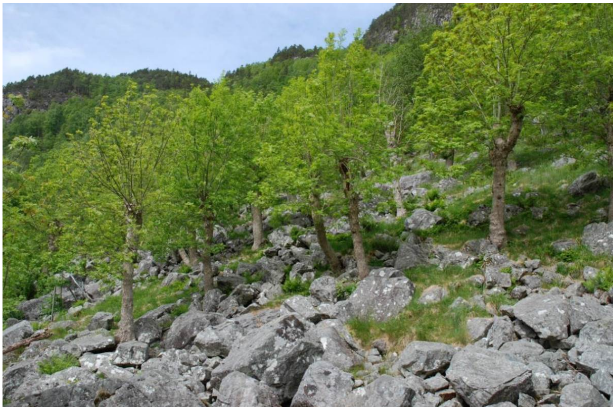
Figur 2. Rik haustingsskog med styvingstre av ask i Målandsdalen, Hjelmeland kommune, Rogaland. Området vart verna som naturreservat i 1984.

Sidan intakte haustingsskogar i dag er sjeldne og dei utgjer rike livsmiljø for mange og dels trua artar, ser myndigheitene det som viktig å ta vare på eit utval av dei. Miljø- og landbruksforvaltninga gjev difor tilskot til skjøtsel av slike skogar og styvingstre. Kontakt Fylkesmannens miljøvernavdeling for nærare informasjon om kva som finst av ordningar i ditt fylke. Mykje informasjon ligg og på nettsidene deira.