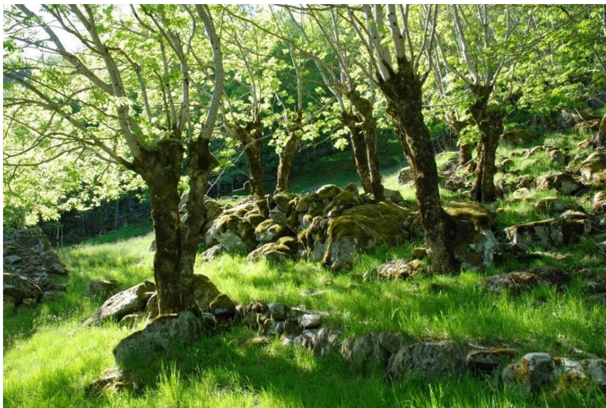
Figur 4. Hagemark med styvingstre av ask i Mogleiv, Suldal kommune, Rogaland. Det er steinete, men nok beitemark til at det reknast som hagemark og ikkje haustingsskog.

Hagemark er ikkje definert som eigen naturtype i NiN, men er å finne som T*32 Semi-naturleg eng prega av beite (-BT), saman med skildring av tre- og busksjiktet med eventuell førekomst av styvingstre (-HT-ST) eller tre som er stubbelauva (-HT-SL).