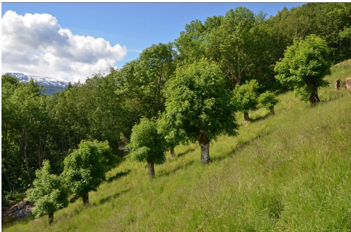
Figur 6. Lauveng, slåtteeeng med styvingstre på Grinde i Leikanger kommune, Sogn og Fjordane.