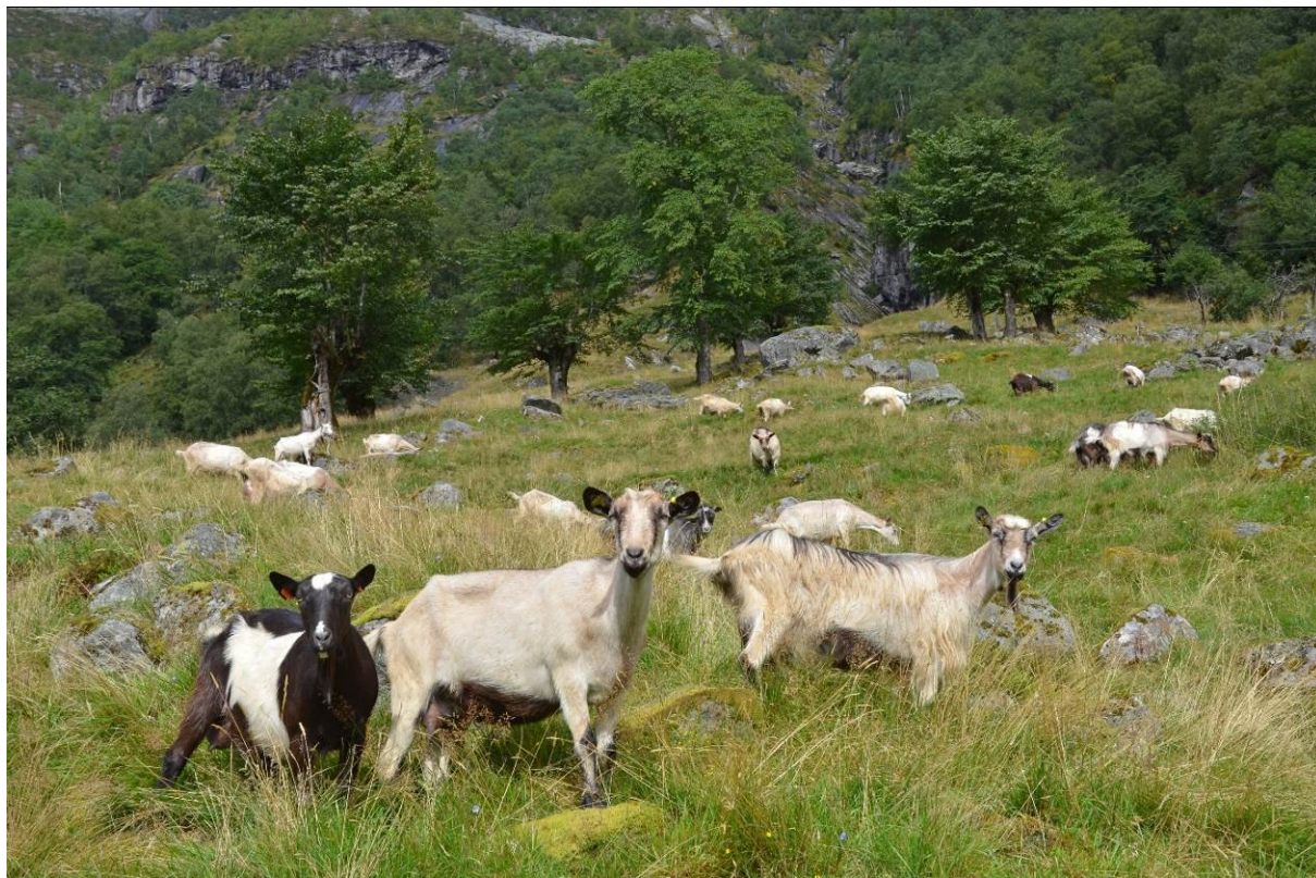
Figur 20. Geiter på beite i tilknytning til haustingsskog i Jølster, Sogn og Fjordane.

Lauvoppslag og «problemartar» som ikkje blir beita eller som veks kraftig og er vanskelege å halde nede (t.d. brennesle, mjødurt og bringebær), må ein rydde manuelt og gjerne fleire gonger per sesong dei fyrste åra.