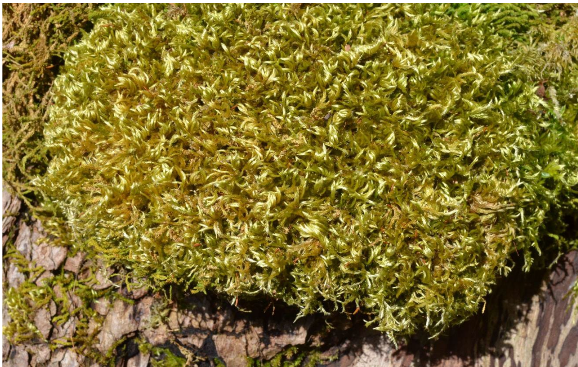
Figur 13. Krypsilkemose Homalothecium sericeum er vanleg på rikbark på game styvingstre.

Det er ikkje berre i restaureringsfasen ein vil få ein gjødseleffekt av tiltaka. Feltsjiktet må haldast i sjakk også etter at ein kjem i gang med den regelbundne skjøtselen. Haustingskogane har tradisjonelt blitt noko beita, helst av småfe (sau eller geit). Ofte er det også glidande overgangar mot hagemark og/eller lauveng. I skjøtselsfasen kan det såleis vera aktuelt både med beite og noko manuell rydding.