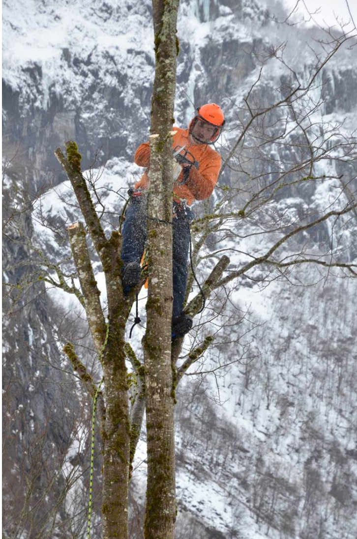
Figur 19. Trepleiar i aksjon med restaurering av eit styvingstre. Merk at han har sikra seg med klatresele og tau.