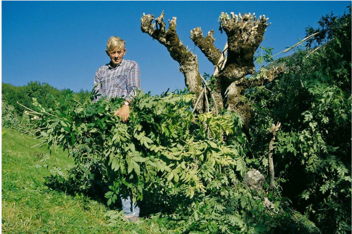
Figur 7. Lauving av ask på Grinde, Leikanger kommune. Sogn og Fjordane.