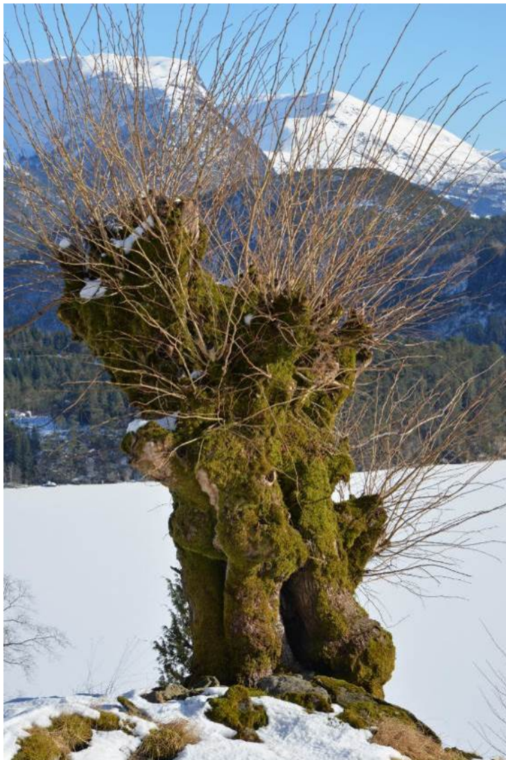
Figur 12. Eit frittstående styvingstre med rik moseflora på stamma.

Haustingsskog er per definisjon styvingstre eller stubbeskotskog på skrinn og steinrik mark. Såleis er det vanlegvis ikkje så artsrikt på bakken rundt trea. Det kan likevel finnast unnatak, til dømes på kalkrik grunn. Steinur av kalkfattig berg kan også ha rike lommer der kalk og mineral er «knust» fram.