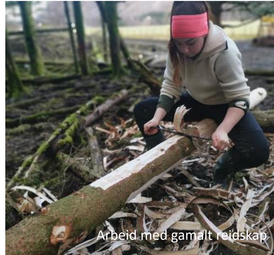
Arbeid med gammalt reidskap

Nye generasjoner får innblikk i korleis landbruket nytta utmarksressursar på 1800 -1900 talet.