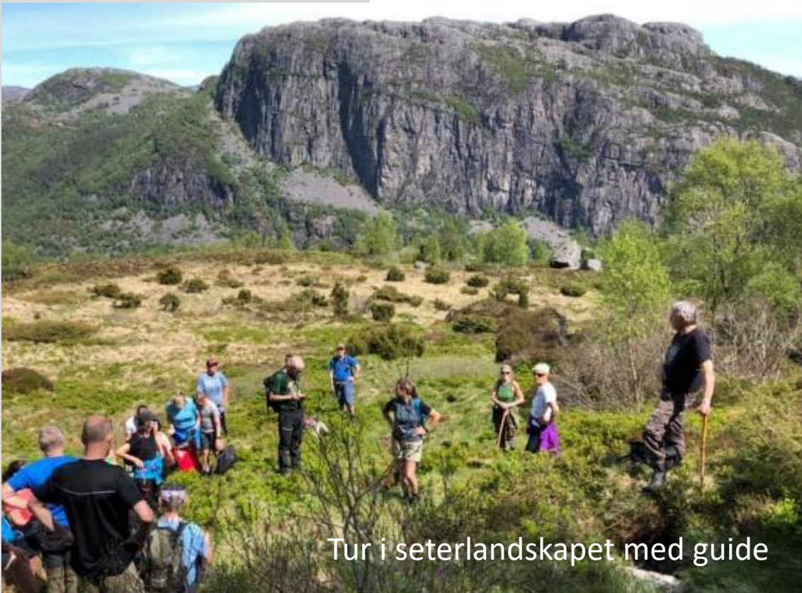
Tur i seterlandskapet med guide