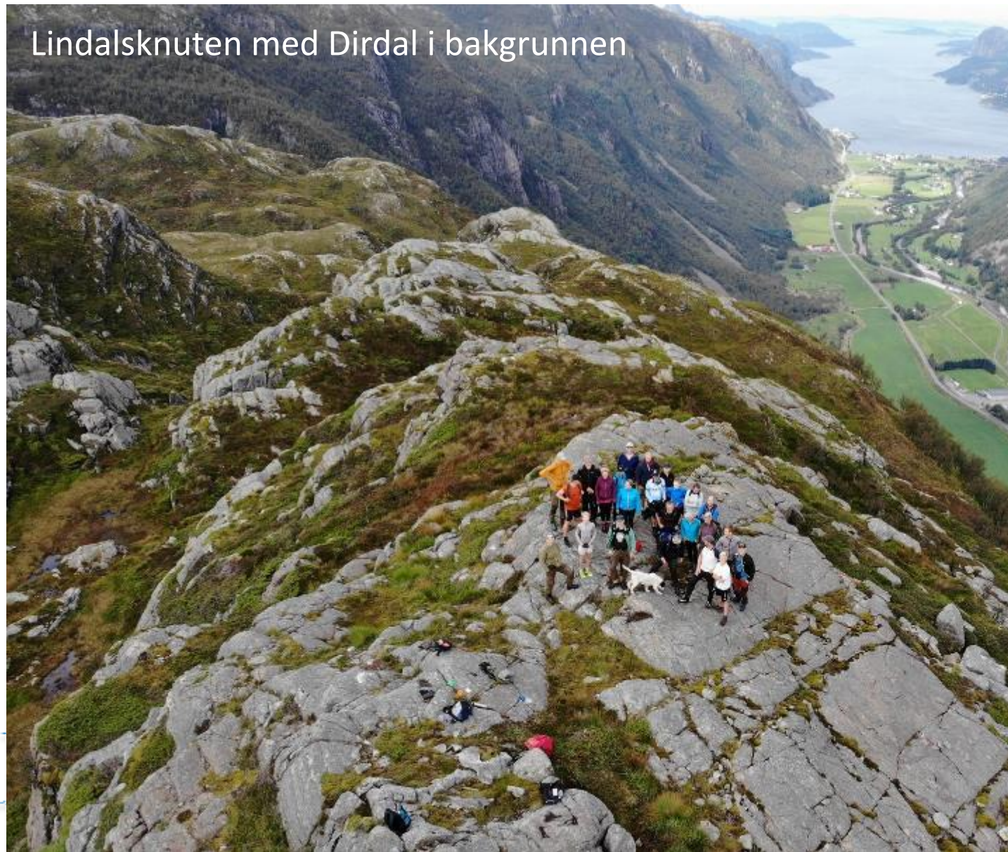
Lindalsknuten med Dirdal i bakgrunnen

Dei får fram samanhengen mellom verdiskaping i utmarka og kulturlandskapet.