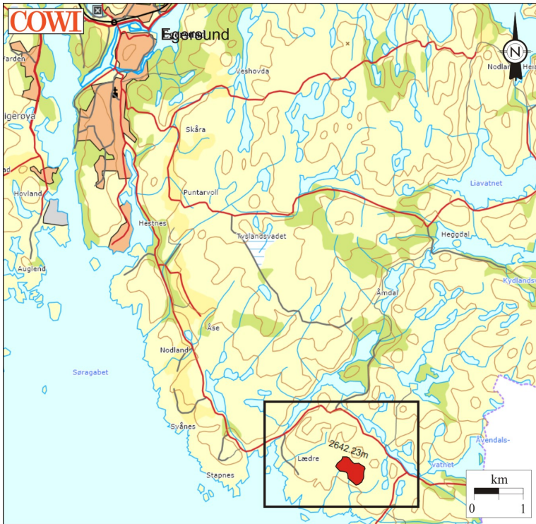
Figur 1 Anlegget ligg sør for Egersund by