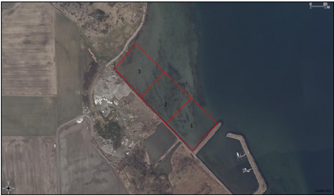
Figur 3. Det ble valgt ut 3 stasjoner på ca. 5,5 daa. Stasjonene gir et godt bilde av forholdene rett utenfor fyllingen.

Metoden som er brukt i undersøkelsen er tilpasset områdets begrensede utstrekning (< 17 daa). Metoden er tilpasset undersøkelser i større geografiske området som fjorder og større havnebasseng. For områder mindre en 30 daa skal det være et minimumskrav at man skaffer data fra 3 stasjoner. Toksisitetstest bør kunne sløyfes i mindre undersøkelser i henhold til TA-2802.