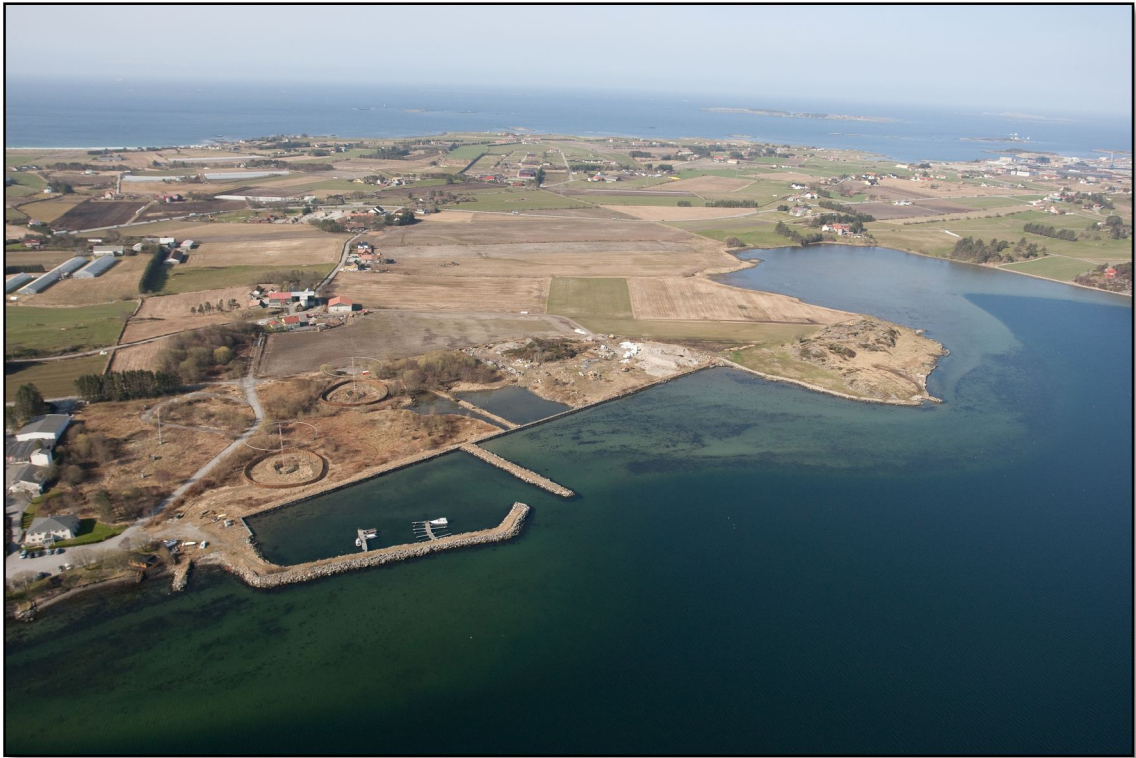
Figur 2. Oversiktsbilde over det aktuelle område. Prøvestasjonene ligger mellom småbåthavnen og odden til høyre i bildet.

De aktuelle sjøarealene er grunne, dvs. fra ca. 30-150 cm. Sedimentene i området består hovedsakelig av sand. Området ligger like ved en småbåthavn eiet av Forsvaret. Det aktuelle området er likevel ikke påvirket i særlig grad av dette da det er svært liten aktivitet i småbåthavnen og ledet til havnen går rett mot dypere vann og ikke inn på aktuelt område. Området er således lite utsatt for mulig propell turbasjon/oppvirvling og spredning av evt. miljøgifter.