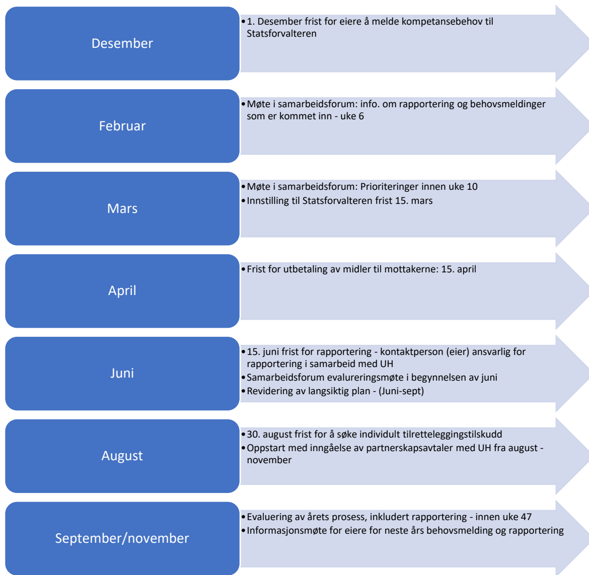
Figur: Årshjul – tidsplan for Rekomp i Troms og Finnmark

Hvem som er representanter i samarbeidsforum, finnes det en oversikt over på Statsforvalterens hjemmeside 22 .