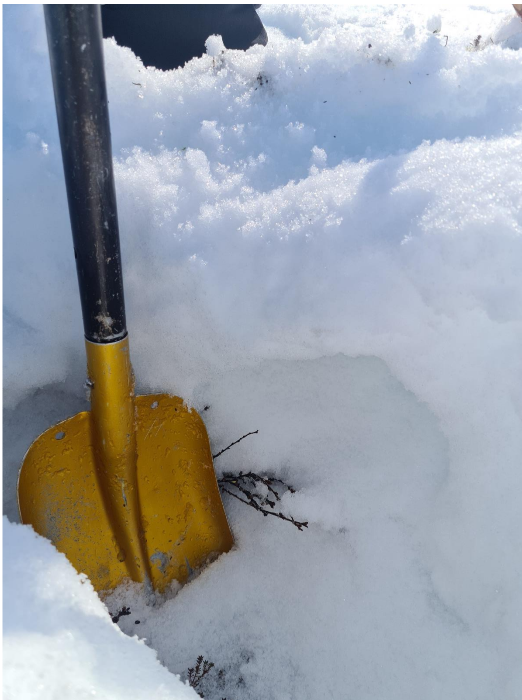
Skarelag øverst, searjåš helt ned til bakken under den.