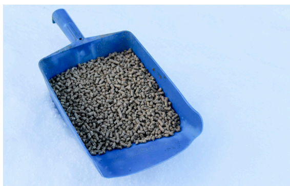
Kraftfôr (bildet) og graspellets inneholder rundt 90 prosent tørrstoff. Dermed frakter man lite vann til fôringsplassen.

Innholdet av tørrstoff i tilleggsfôret er viktig når du skal velge mellom de ulike fôrtypene. Tørrstoff er den delen av fôret som ikke er vann og som dyrene skal hente næring fra gjennom fordøyelsessystemet. Fuktig fôr, med lav tørrstoffprosent, er dyrt å transportere og fryser lett