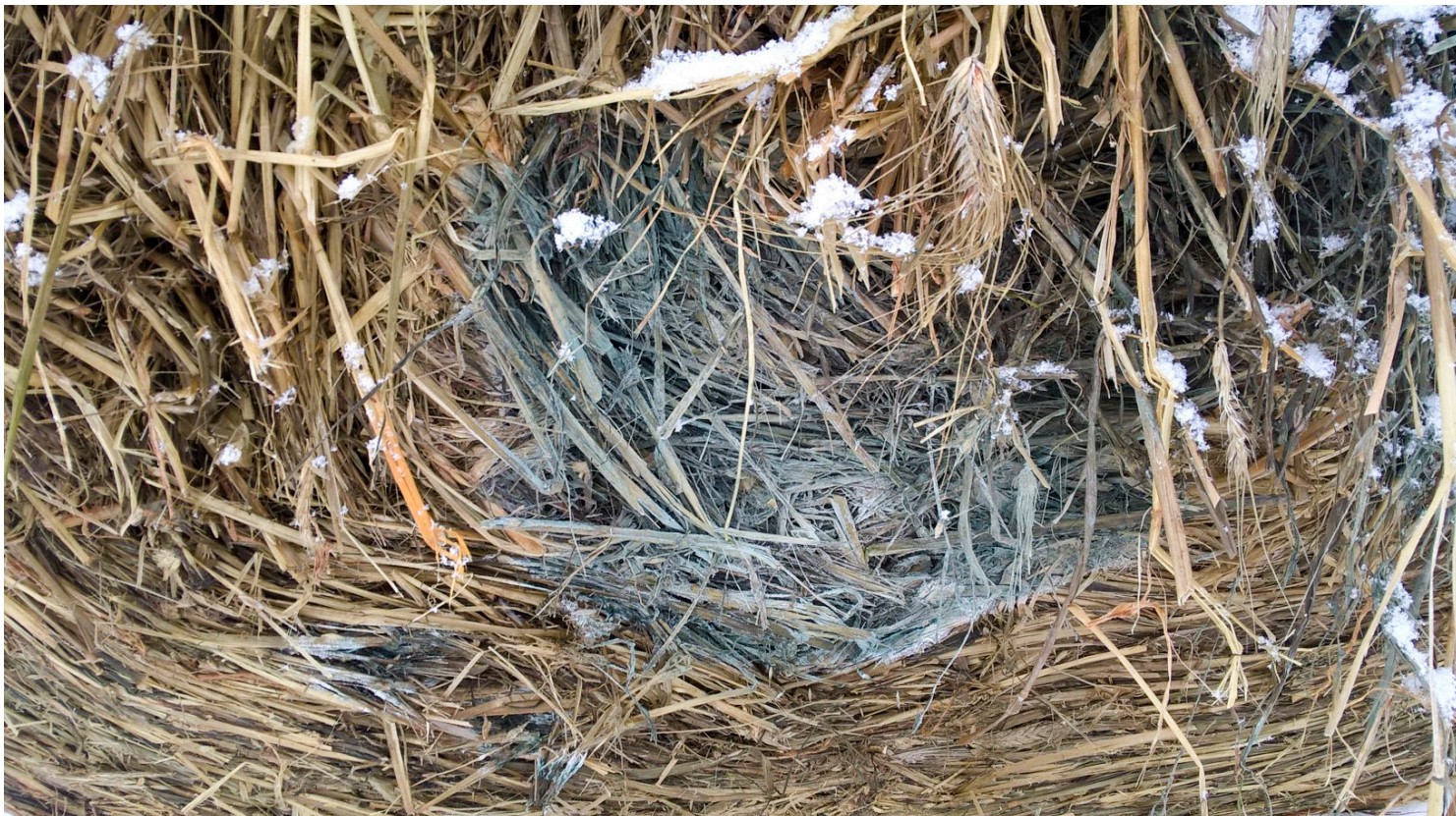
Rundballer med mugg skal IKKE brukes som tilleggsfôr for reinsdyr.