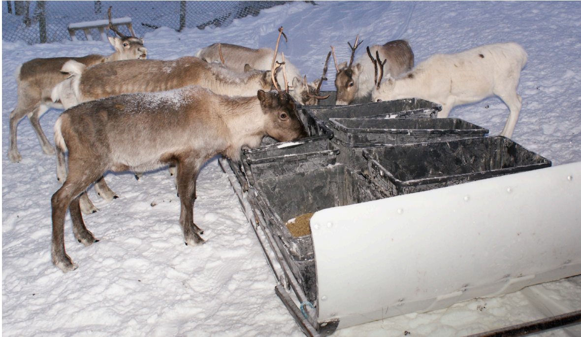
Slede for transport av tilleggsfôr.

verdi som tilleggsfôr for rein. Fôr fra 2. slått, som er rik på blader, kan også benyttes. Ved lavt innhold av tørrstoff betaler du mye for vann, særlig dersom prisen er per rundball og ikke per kilo tørrstoff.