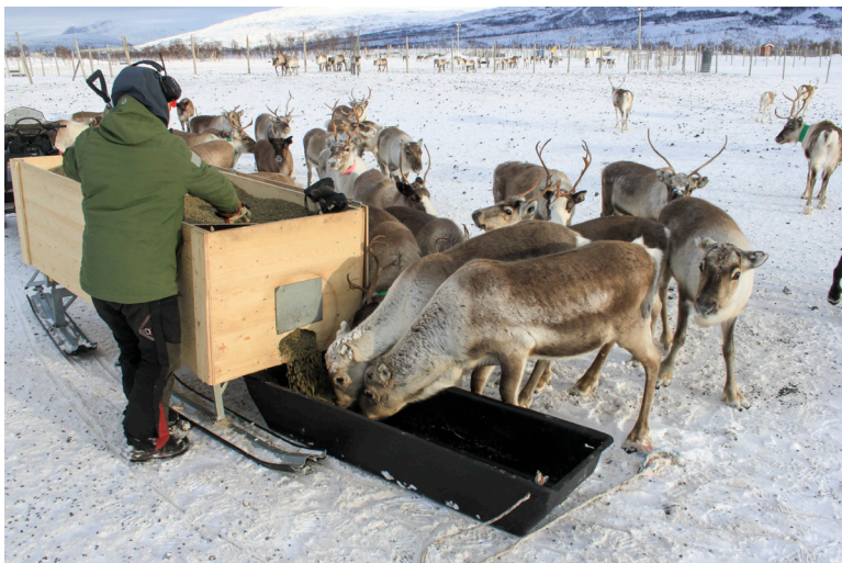
Mange reineiere har ulike erfaringer med tilleggsfôring. Men, alle reineiere som fôrer reinen på det samme området over en lengre periode – både på snø og barmark – anbefaler bruk av fôrtrau – også ved løse snøforhold og ved fôring med kraftfôr eller gras pellets.

Om vinteren dekker reinen mye av vannbehovet ved å spise snø. Ved fôring i inngjerdet område skal reinen ha tilgang på rent vann siden snøen fort blir forurenset med avføring. Det beste er å ha tilgang til en bekk som renner gjennom området. Velg helst en lokalitet med godt drenert grunn – gjerne på en høyde eller i et