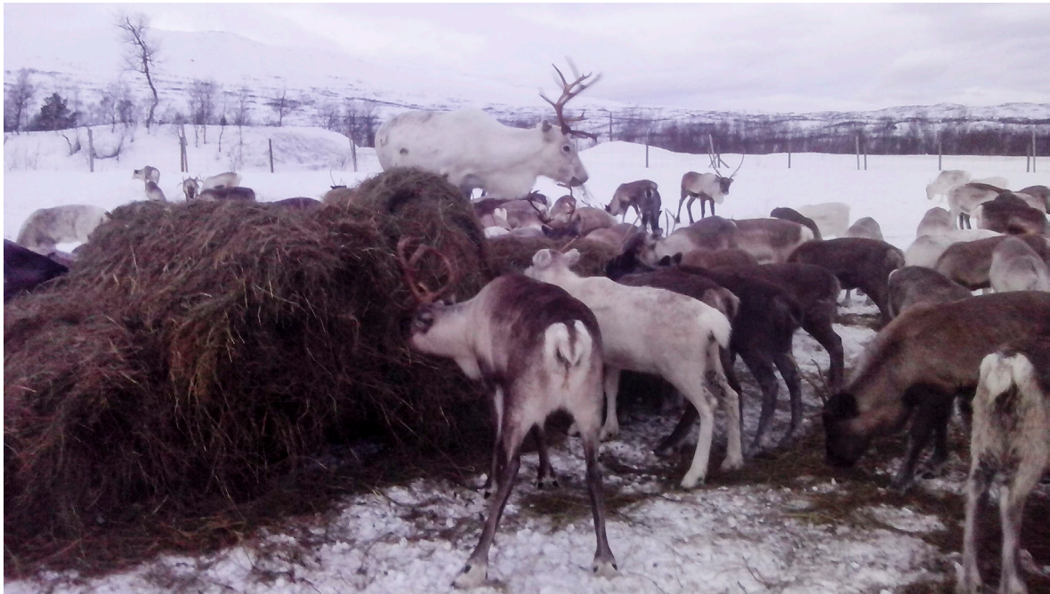
Reinsdyr som spiser grovfôr i rundball. For å sikre en god utnyttelse av det nye fôret, bør en starte tilleggsfôringen før reinen begynner å sulte. Følg nøye med på beitetilgangen!