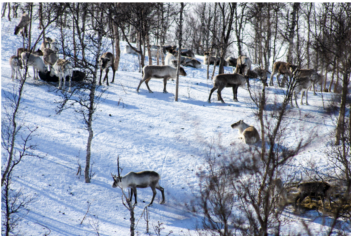
Tilbakemeldinger fra reineiere med praktisk erfaring fra tilleggsfôring er at det er viktig å fôre over et så stort område at SAMTLIGE dyr får tilgang på maten SAMTIDIG.

bedret kondisjon, samtidig som de mindre dyra sultes til døde. Enkelte reineiere gir opp til to kg kraftfôr per dag for hver rein de har i flokken, for å sikre at alle dyra får tilgang på fôr. Andre mener at 0,75 kg per dag er tilstrekkelig dersom det kombineres med at reinen får høy/rundball, eller beiter fritt i tillegg.