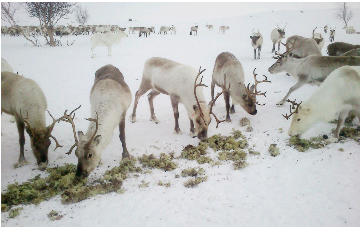
Ved skifte av type fôr, eller ved overgang fra beite til tilleggsfôr, trenger reinen tid til å venne seg til smaken. Dersom du har tilgang på lav, vil innblanding av lav i tilleggsfôret de første dagene gjøre at reinen raskere begynner å spise av fôret. Når reinen plukker ut laven, får den også opp smaken for tilleggsfôret.

tillleggspôret direkte på bakken til å begynne med. Dette fordi det er reinens naturlige sted å søke etter mat og den vil begynne å «plukke i», og etter hvert begynne å spise av tilleggspôret.