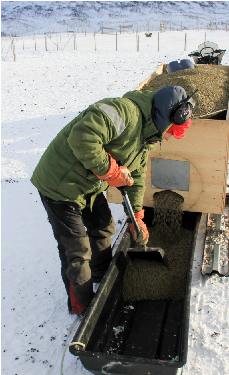
Ved bruk av kraftfôr, anbefales fôr tilpasset reinsdyr, slik som Reinfôr bas. Alle de norske kraftfôrleverandørene leverer fôr tilpasset reinsdyr.

hellende terreng – for å unngå opptråkking som kan gi gjørme og våte og forurensede forhold. I tillegg bør dyra ha god plass, for å unngå at de blir gående i egen avføring. Behovet for drikkevann øker når du fører med tilleggsfôr som inneholder lite vann.