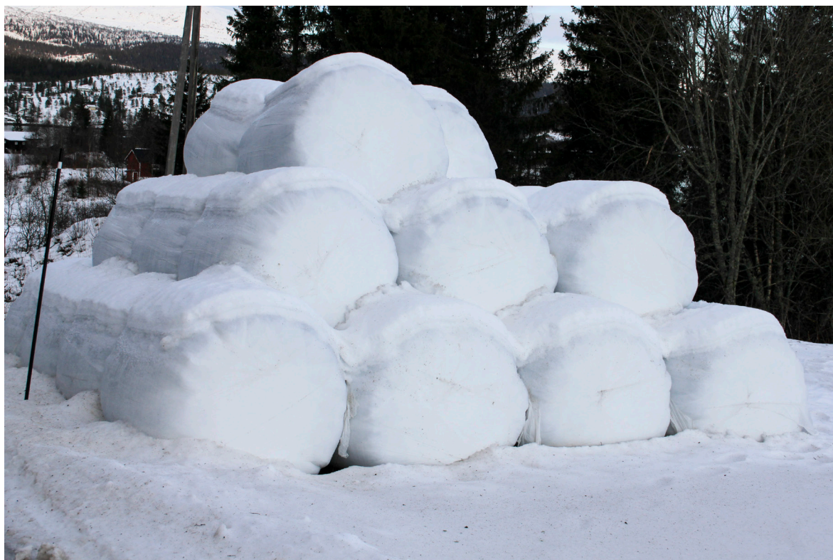
For at reinen skal kunne utnytte rundballer som tilleggsfôr, må kvaliteten være god. Rundballer med mindre enn 25 prosent tørrstoff vil fryse til harde «klinikuler» i kuldeperioder.

Dersom du gir for lite fôr, eller har for få fôringsplasser, vil de dominerende dyra spise opp maten. På grunn av det sterke flokkinstinktet, vil de mindre dominerende reinsdyra oppholde seg sammen med flokken i utkanten av fôringsplassen. Dermed bruker de heller ikke naturlig beite, og tilleggsfôringen vil forsterke sultproblemet for de svakeste dyra. Med for lite tilleggsfôr risikerer du at de store dominerende reinsdyra får