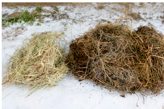
Høy til venstre i bildet er av god kvalitet og er velegnet som tilleggsfôr til rein. Høyet til høyre er fukt- og muggskadet og må ikke bukes som fôr til rein. Innholdet av ulike typer gras og urter i enga påvirker smakeligheten på høyet.

på snøen, og over et stort område, slik at alle dyra enkelt får tilgang til fôret.