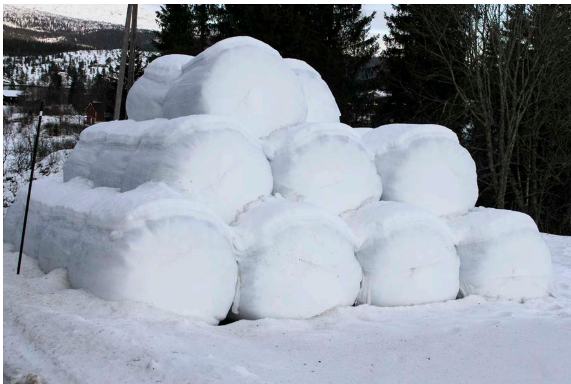
Suoidnespáppain ferte leat buorre kvalitehta vai boazu sáhtta dain ávkki atnit liigebiebmun. Suoidnespáppat mat sisttisdollet unnit go 25 proseantta goikeávdnasa jikŋot garra spábban buolašin.

Buvttadeaddjit ávžžuhuvvojit garrasit atnit ensilerenávdnasiid suoidnespáppain sihkkarastin dihte ahte gevvat riehta ja váras váldin dihte energiija, earret eará sohkkara mii suddá čázis. Iskkadeamit čájehit ahte bohccot leat váibmileappot suoidnespáppaide maidda leat lasihuvvon ensilerenávdnasa.