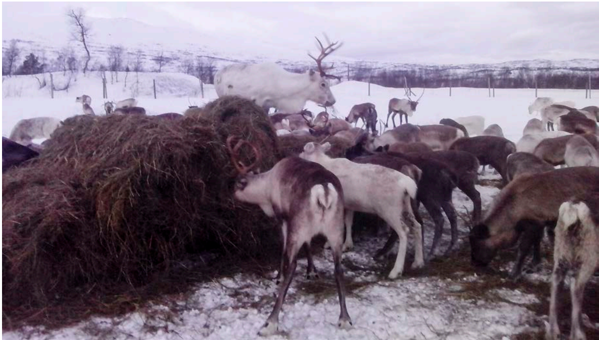
Bohccot mat borret roawwafuođđara suoidnespáppain. Bohccuid berre biebmagoahtit ovdal go nealgogohtet, sihkkarastin dihte ahte boazu atná ávkki odđa fuođđaris. Čuovo dárkilit mielde mo guohtundilálašvuodat leat!!