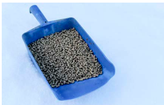
Fápmofuođđarat (govas) ja rásse-pelletsat sisttisdollet sullii 90 proseantta goikeávnna. Dainna lágiin fievrrida unnán čázi biebmabáikái.

Liigefuođđara goikeávnnessidoallu lea dehálaš go galgat válljet iešgudetlágan fuođarsorttaid gaskkas. Goikeávnna lea dat oassi fuođdaris mii ii leat čáhci ja mas bohccot galget suolbmudanoliin oažžut biepmu. Njuoska fuođđara, mas lea vuollegis goikeávnna-proseanta, lea divrras fievrridit ja dat jiekŋu álkít.