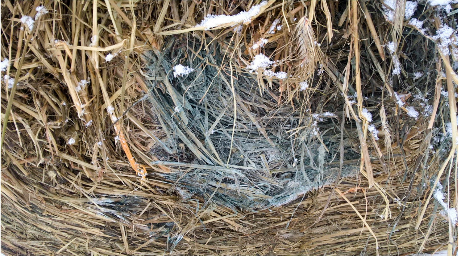
Il galgga biebmát bohccuid suoidnespáppaiguin mat leat guhppon.