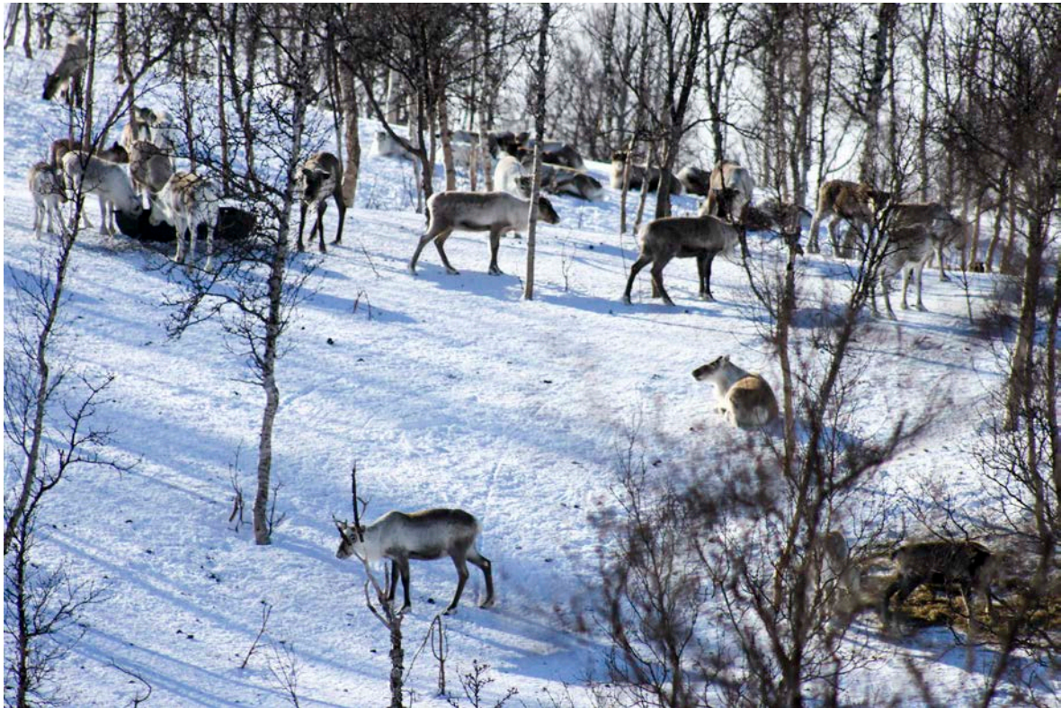
Boazodoallit geat leat hárvánan biebmat leat muitalan ahte lea dehálaš biebmat dan máde viiddis guovllus ahte BUOT bohccot ožžot biepmu OKTANIS.

sat, go buohtastahtta suoidnespáppaiguin maidda ii leat mihkkege lasihuvvon. Nu movt suinniiguin, de lea dehálaš ahte rássi ii ge láddjejuvvo beare manjit šad-danáigodagas vai boazu sáhtta suolbmudit fuođđara ja ávkki atnit rási biepmus.