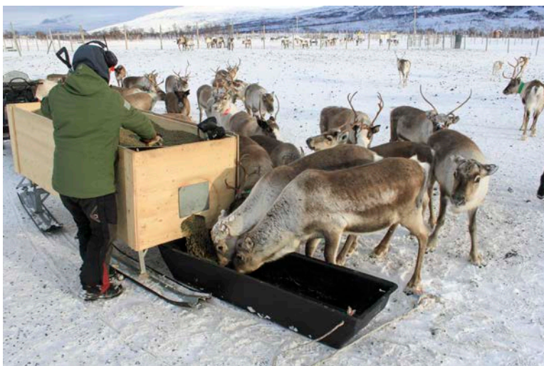
Olu boazodolliin leat iešgudetlágan vásáhusat biebmaniin. Muhto, buot boazodoallit geat bibmet seamma guovllus guhkit ággi – sihke muohtan ja bievlan – ávžžuhit atnit fuođargári – maiddá obbasis ja go bibmet fápmofuođđariiguin dahje rásse-pelletsain.

guhkimusas eret biebmanajis. Ja go nu dahket, de eai guođo dábálaš guohtuneatnamiin ge, ja biebman dagaha eanet nealggi geahnohis bohccuide. Jus biepmat beare unnán, de lea várra ahte stuora, gievrras bohccot ožžot buoret vuoimmi, seammás go unnimus bohccot nelgot jámas. Muhtin boazodoallit addet lagabui guokte kilo fápmofuođđara beaivválaččat juohke bohcco nammii ealus, sihkkarastin dihte ahte buot bohccot ožžot borrat. Earát ges oaivildit ahte 0,75 kg beaivái lea doarvái jus kombinere suinniiguin/suoidnespáppain, dahje jus guhtot vel dasa lassin.