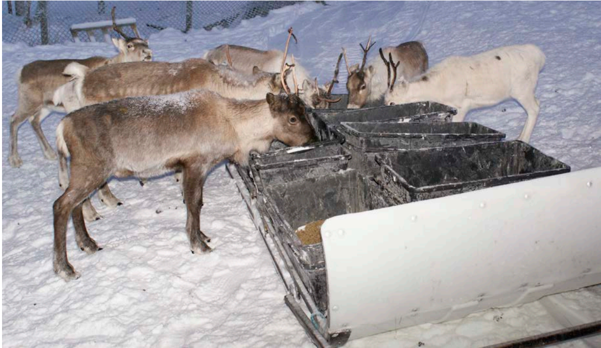
Reahka mainna fievrrida fuođđariid.