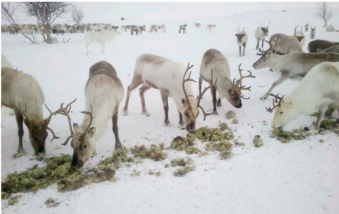
Go lonuha fuođđara, dahje go guohtumis sirdá fuođđariidda, de dárbaša boazu áiggi hárvánit máhkui. Jus dus leat jeahkát olámuttus, de sáhtát seaguhit liigefuođđara jeahkáliidda vai boazu jođáneappot borragohtá fuođđara. De boazu borrá jeahkála mas lea liigefuođđara máhku.

Dat lea danne go boazu lunddolaččat ohcá biepmu eatnamis, ja nu dat álgá «čuoggut», ja loahpas borragohtá biepmu.