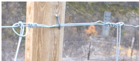
Detalj som viser skjot og festing av netting med spiker.

Spiker er anbefalt framfor kramper. Ved store snømengder, eller når elg presser på gjerdet, vil spikeren bøyes ut uten at netting eller stolper ryker