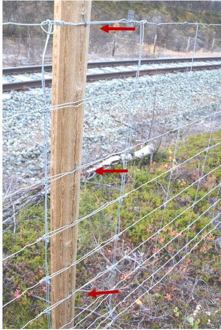
Gjerdet festes med 3 spikre (røde piler) - spikerdimensjon 2,8x75 mm. Skjøten har minst ei nettingrute overlegg.

Spiker er anbefalt framfor kramper. Ved store snømengder, eller når elg presser på gjerdet, vil spikeren bøyes ut uten at netting eller stolper ryker