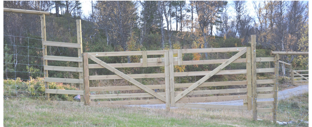
Et eksempel på dobbel grind. Merk forsterkningene på begge sider av grinda.