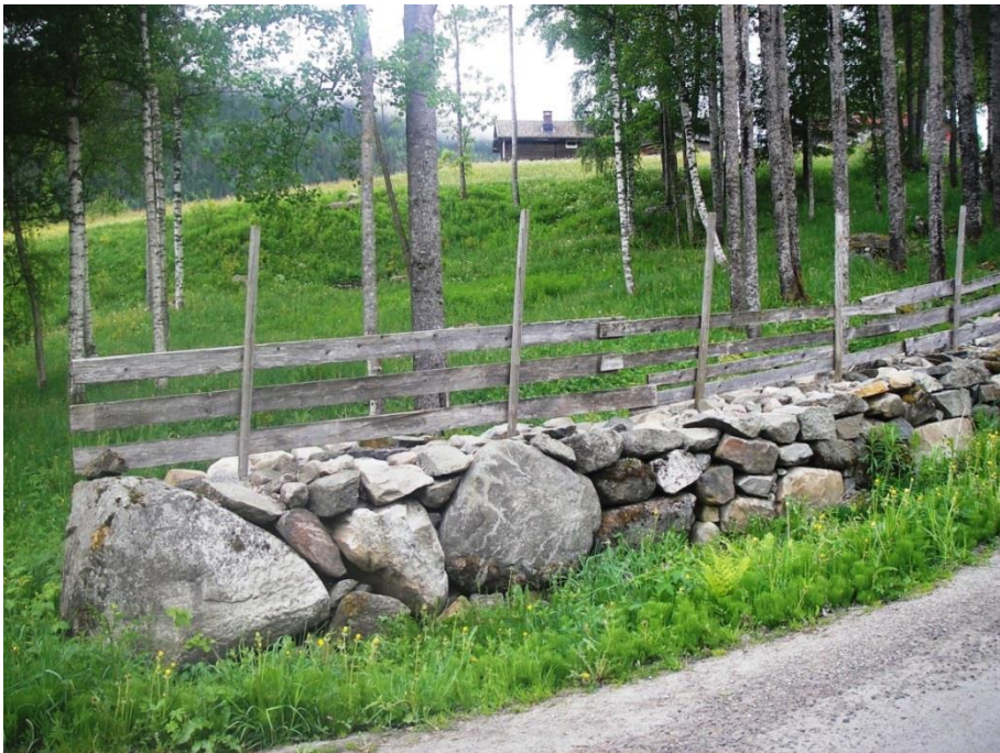
Figur 11. Steingard mellom Sud-Hovland og Bratsberg i Hjartdal, restaurert under eit kurs i regi av Kulturlandskaps-senteret i 2012.