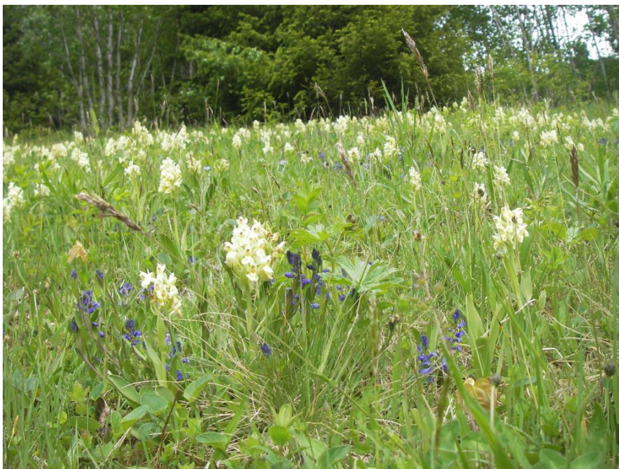
Figur 6. Vårflora med systemarihand og blåfjør på slåttemark på Ambjørndalen i Hjartdal. Dette er ein av mange lokalitetar med den slåttemarkstilknytte og raudlista orkideen systemarihand i Hjartdal og Svartdal UKL.