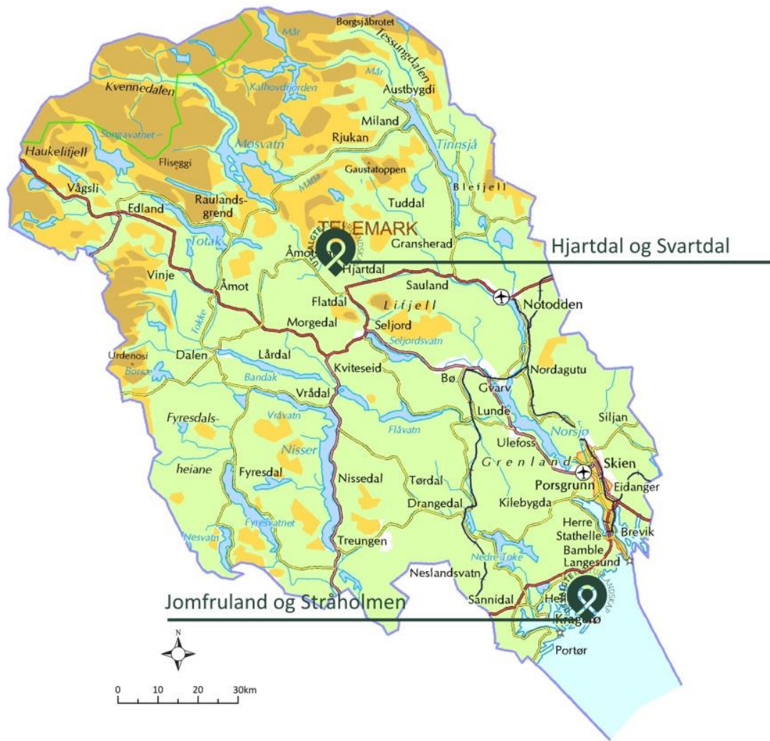
Figur 1. Hjørtedal og Svartdal UKL ligg i Øvre Telemark. Hjørtedal høyrer til Aust-Telemark, Seljord til Vest-Telemark. Ute ved kysten ligg det andre utvalde kulturlandskapet i Telemark per 2018, Jomfruland og Stråholmen UKL.