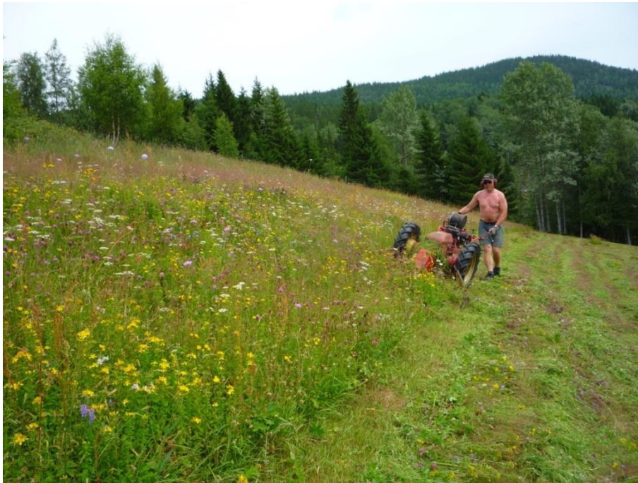
Figur 5. Slått av ekre (jorde lagt om til eng) på Sud-Århus i Hjartdal. Over tid har mange ekre utvikla dei same kvalitetane og artsrikdomen som dei «ekte» slåtteengene. Hovudelementa er inga gjødsling og sein slått. Håslått og/eller haustbeite er også positivt for å betre tilhøva for dei slåttemarkstilknytte artane.

Dei tradisjonelle slåtteengene er levande kulturminne, og viktige for opplevinga av bygdlandskapet vårt. Avkastinga er sjølvsagt lita i samanlikning med gjødsla og fulldyrka eng, sjølv om den næringsmessige kvaliteten er høg («medisinhøy»).