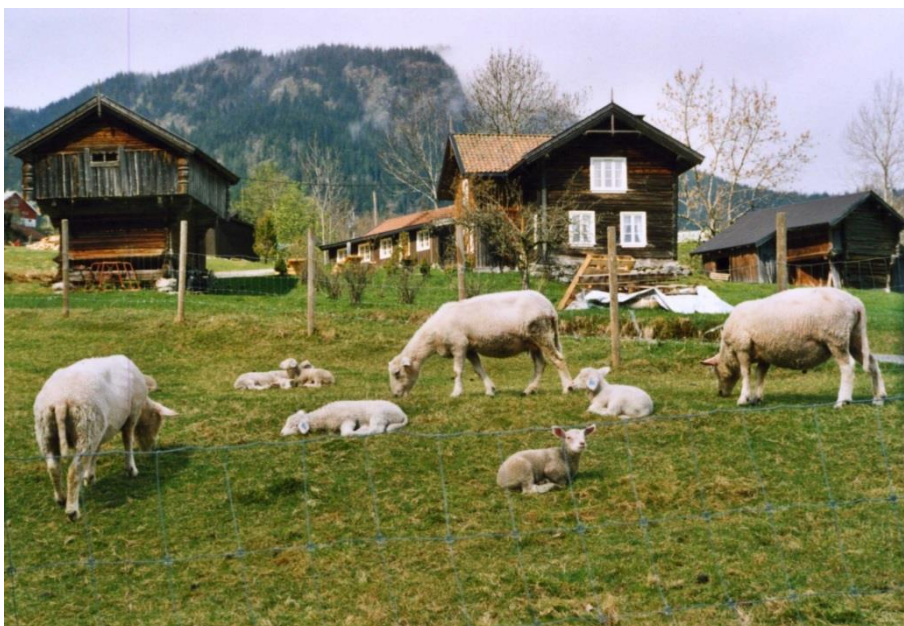
Figur 3. Sauer på beite på Sud-Hovland i Hjørtedal. Sud-Hovland er ein gamal gjestgjevargard. Den ligg fint til i eit gamalmodig og samstundes levande kulturlandskap, med aktivt dyrehald både på eigen gard og på grannegardane.