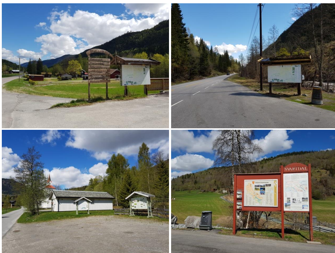
Figur 13. Turistinformasjonspunkt ved Bygdesentralen (oppe t.v.), i vestre del av Ambjørndalen (oppe t.h.), ved Hjartdal kyrkje (nede t.v.) og i Svartdal (nede t.v.). Ved Hjartdal kyrkje er det ei tavle med vanleg turistinformasjon og ei tavle med kulturlandskapstema.

Per 2018 er det tre tavler med turistinformasjon innanfor området, samt ei tematavle om kulturlandskap. Turistinformasjonstavlene er i varierende forfatning og treng ei oppdatering og ei samkøyring. UKL sin profilbank for skilt skal leggast til grunn med ein samkøyring av skilt i området.