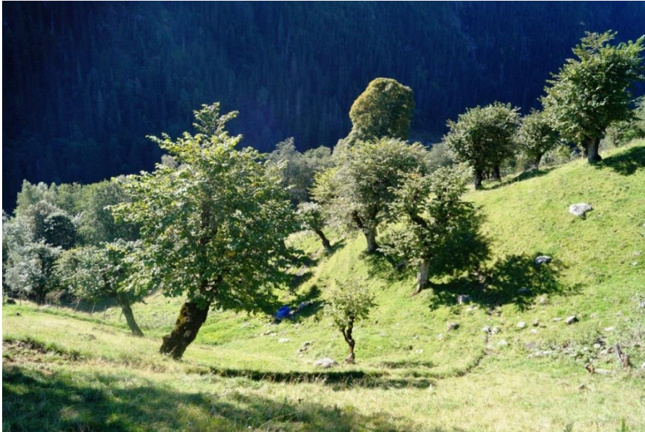
Figur 7. Styvingstre av alm i lauvingslia på Myljom-To i Hjartdal.