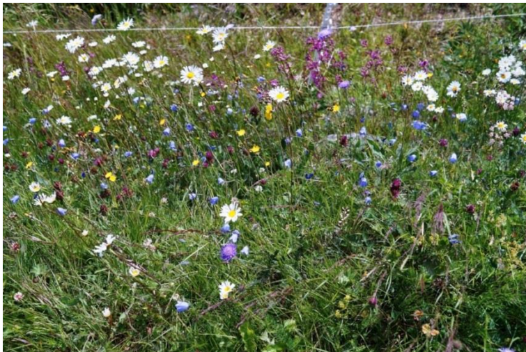
Figur 17. Prestekragar, blåklokker og tjøreblom i ein vegkant i Svartdal. Desse tre kjende og kjære blomane er gode karakterartar for gamal slåttemarksflora.