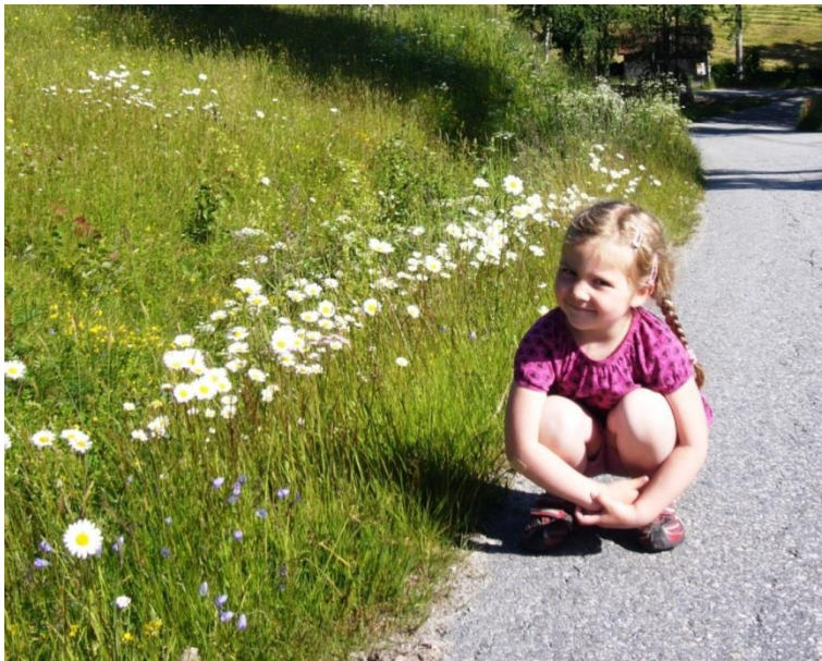
Figur 16. Fint å gå ein sommarmorgon langs Holmsvegen i Hjørtedal, for liten og stor, innbyggjar og tilreisande.

Som det går fram av kap. 3.2 er det utfordringar knytt til å ta vare på dei meir kvardagslege innslaga av blomerike enger i landskapet, så som middels artsrike veg- og jordekantar. I denne samanhengen er det viktig å inspirere til innsats.