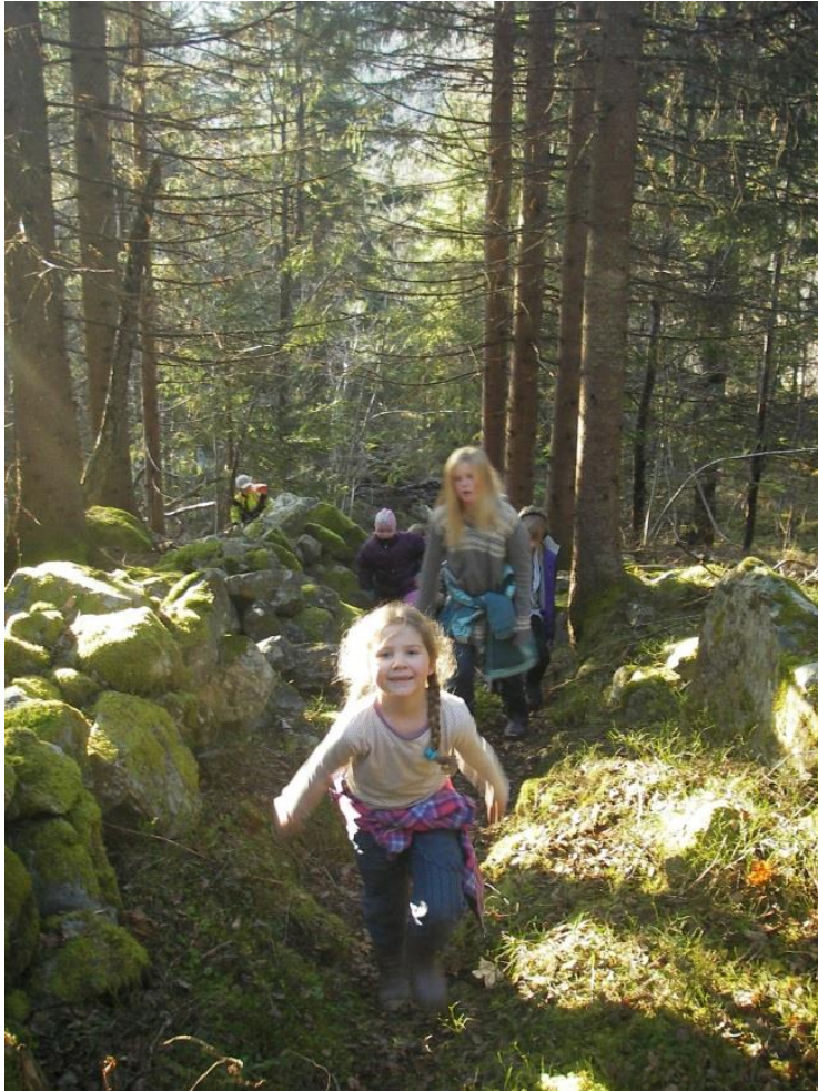
Figur 12. Skuleelevar på tur opp Grøpåstadgutu. Kulturlandskapsgruppa i Hjordal rydda og skilta denne i seinare tid. Den tida gutu kom på plass var det ikkje granskog her, men eit ope landskap med enger og åkerlappar i kring. Det er fleire tufter etter husmannsplassar langsetter denne bufersvegen.