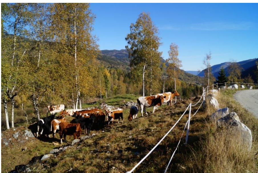
Figur 4. Kyr frå Teleros samdrift, Hjørtedal. I samband med bygging av samdriftsfjøset blei det rydda fram att mykje gamalt beitelandskap i området. Området eignar seg godt for å ta i mot grupper, både med tanke på utsyn, møtelokale i fjøset og kombinasjonen av gamalt og nytt.

Det er eit generelt utviklingstrekk for norsk landbruk i dag at det blir stadig færre aktive bruk og meir leigejord. Ei av utfordringane med dette er at areala utanom den mest lett drivne åkerjorda («traktorjorda») etter kvart går ut av hevd og gror att. Dei få som driv aktivt og har mykje tilleggsjord kan vanskeleg syte for at alle kantsonene også blir slegne og/eller beitt. Dette handlar litt om lønsemd og mykje om kapasitet. I nokre tilfelle, der det er kartlagt særskilt artsrik eng i kantane mot dyrka mark, blir det gjeve tilskott til tilpassa skjøtsel (inga gjødsling, sein slått etc.). Dette har for Hjørtedal og Svartdal UKL sin del bremsa noko på den negative trenden med at kantsoner gror att. Det er like fullt også her ei generell utfordring å halde kantsoner i hevd. Dette bør ein bite seg merke i, da det er nettopp i kantsonene til dyrka mark at både dei biologiske og dei kulturminnemessige verdiane ofte er å finne.