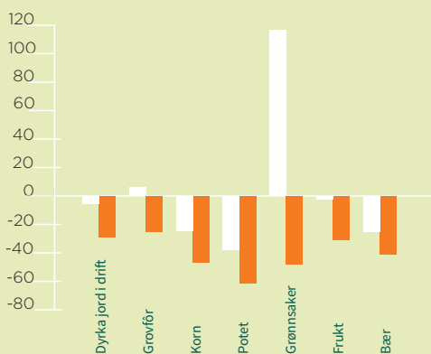
ENDRINGER I AREAL OG ANTALL FORETAK I TELEMARKE I PERIODEN 2003 TIL 2016: