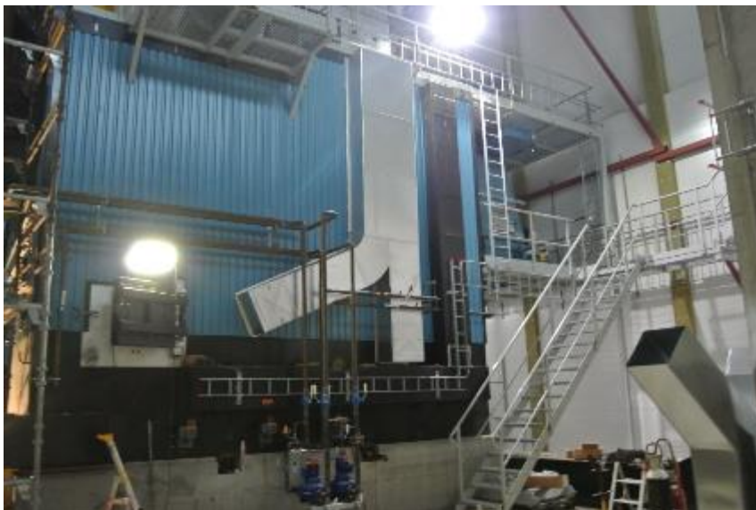
Figur 3, Bilde viser en av de to biobrenselovnene.