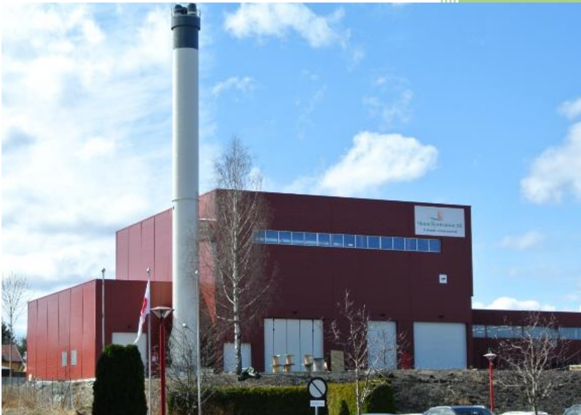
Skien Fjernvarmes varmesentral – Nylende - Skien