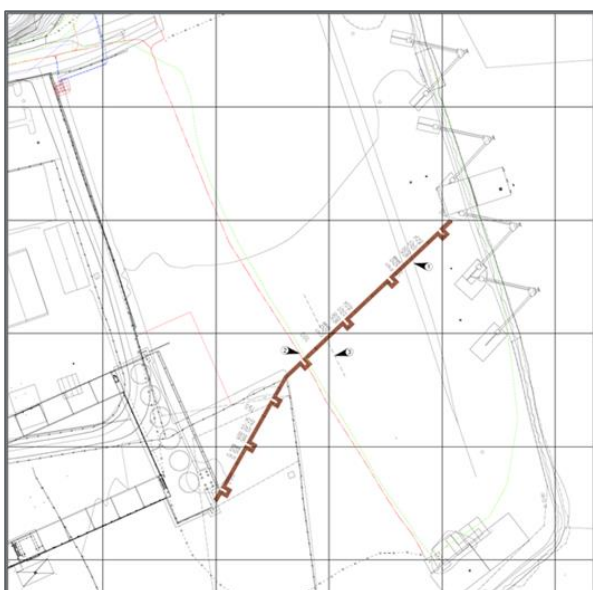
Utsnitt fra situasjonsplan

Ett av tiltakene i forbindelse med CO 2 -fangstanlegget, er forberedelse for utskipning av CO 2 med skip fra Breviksterminalen. I grensen mellom Tangen Eiendoms arealer og Norcems arealer vil det bli etablert et tankanlegg for mellomlagring av flytende CO 2 . Tankanlegget vises nede til venstre på tegningsutsnittet under.