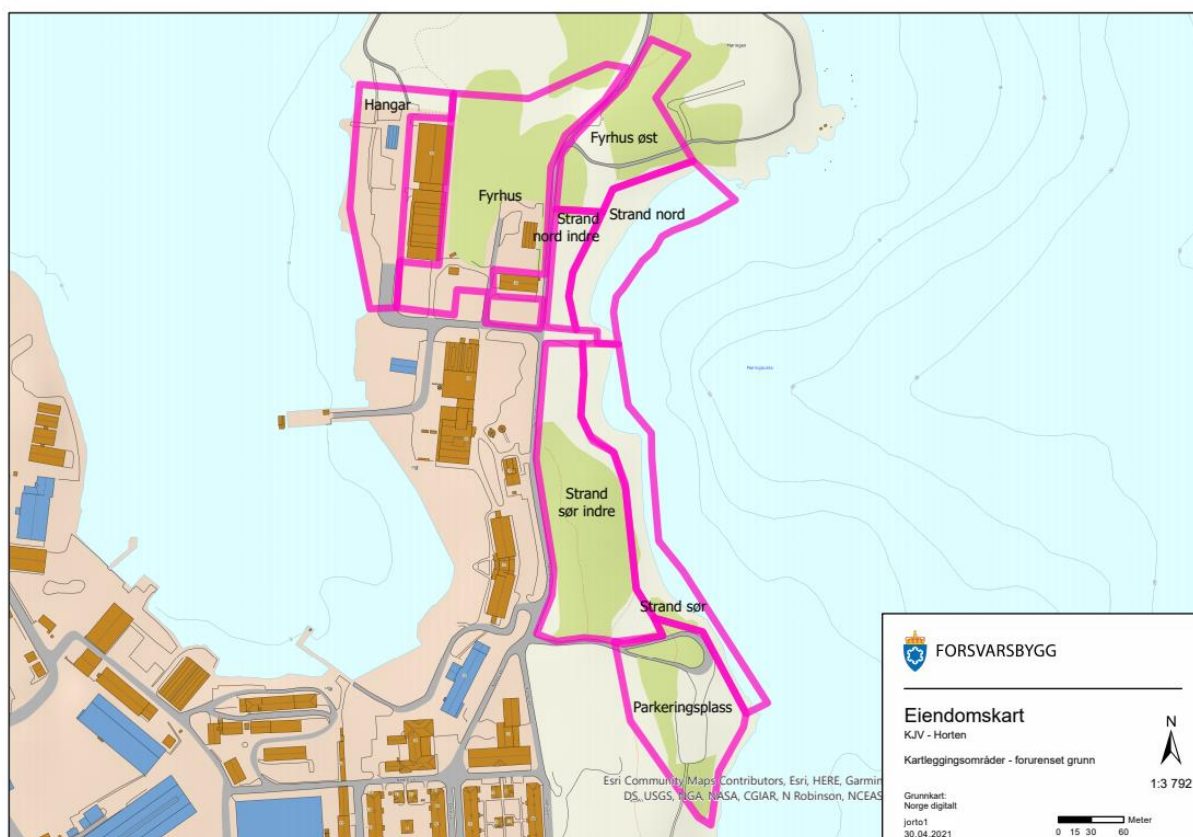
Figur 3: Delområder KJV/Møringa