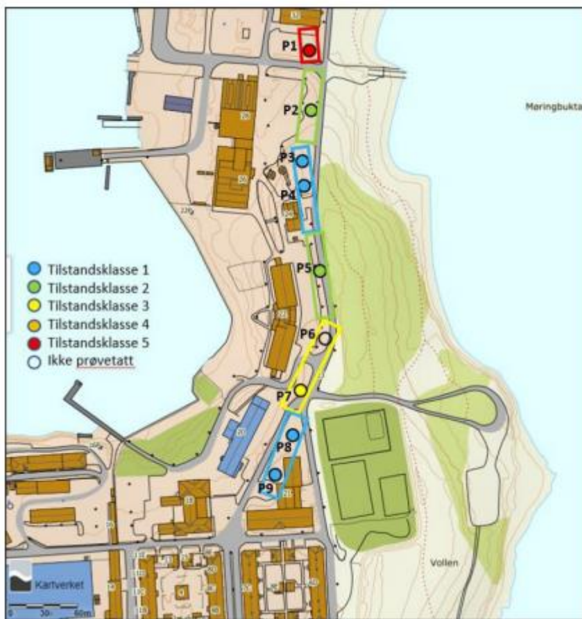
Figur 1: Prøvepunkter i fjernvarmetrasé, . Farge viser høyeste tilstandsklasse klassifisert iht. Miljødirektoratets veileder TA-2553/2009

I 2020 tok Forsvarsbygg noen prøver i en kabelgrøft bak den gamle hangaren på området (se figur 2). Disse viste stedvis høye konsentrasjoner av miljøgifter. I samme tidsrom ble det varslet om skrot på «strand sør». Her så vi at det var behov for kartlegging av forurenset grunn. Dette førte til etableringen av et eget prosjekt, som skulle se på hele området. Det ble laget et kart, som delte området inn i ulike delområder, basert på historikk og arealbruk (figur 3).