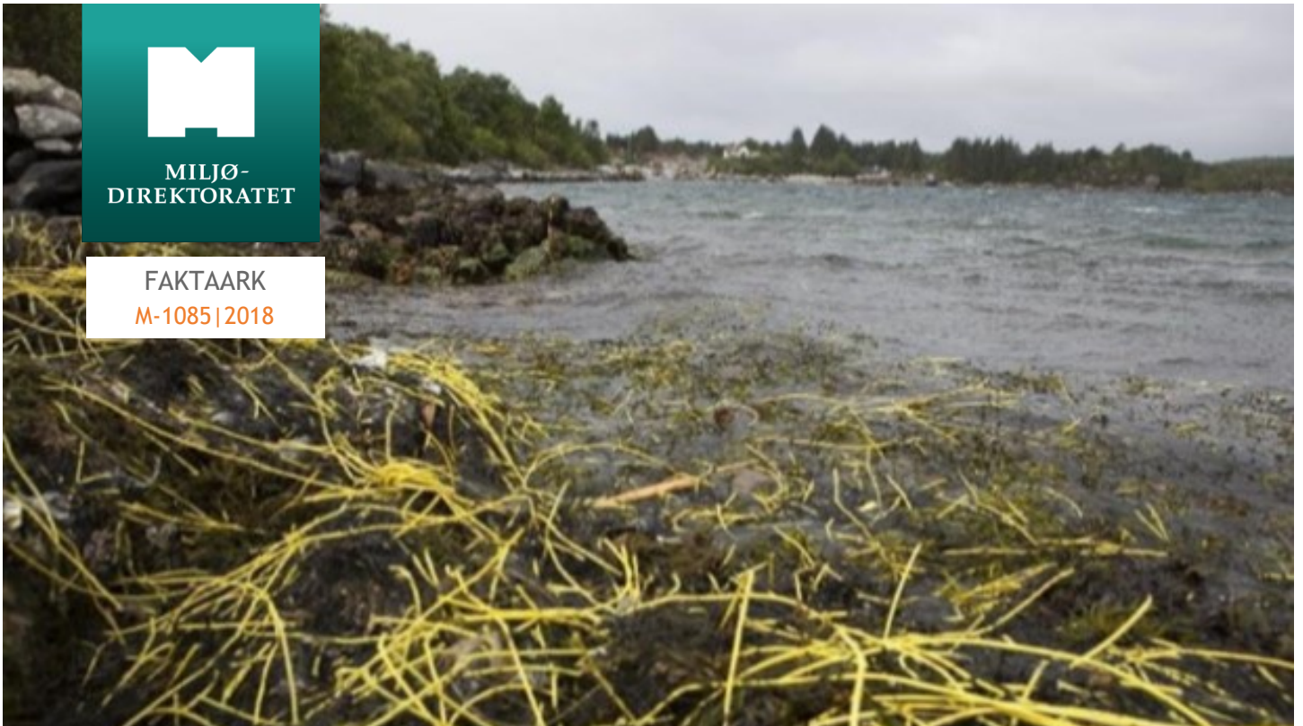
Ikke-elektriske tennerledninger (sjokkslanger) som har drevet på land.