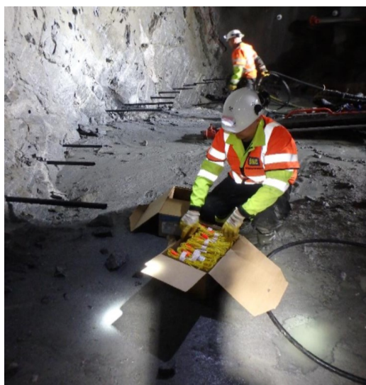
Foringsrør i borehull.

Det er imidlertid viktig at aktørene i bransjen jobber aktivt for å redusere plastbruken i prosjektene sine. Alternative materialer til plast bør for eksempel prøves ut og etterspørres.