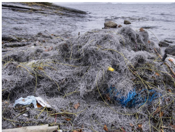
Plastarmering på strand.