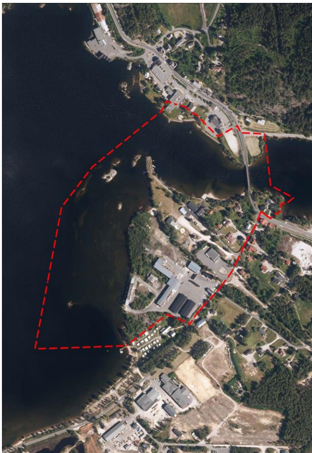
Flyfoto over planområdet