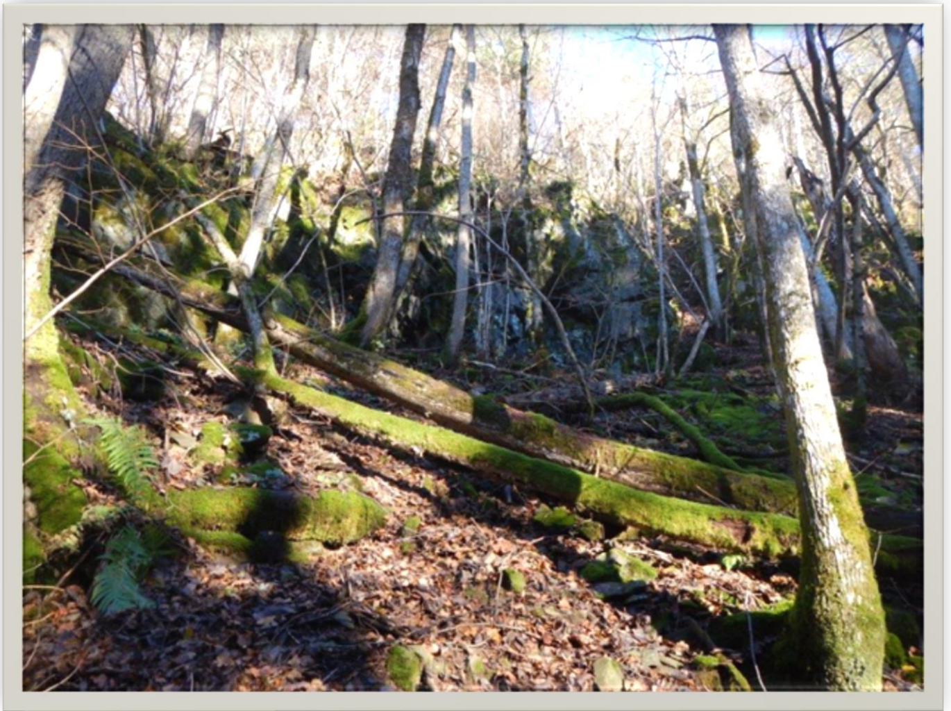
Tørr lindeskog i parti med rikelig med læger.