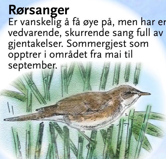
Rørsanger Er vanskelig å få øye på, men har en vedvarende, skurrende sang full av gjentakelser. Sommergjest som opptrer i området fra mai til september.