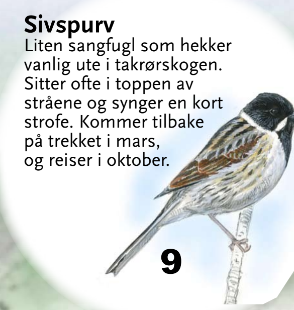
Sivspurv Liten sangfugl som hekker vanlig ute i takrørskogen. Sitter ofte i toppen av stråene og synger en kort strofe. Kommer tilbake på trekket i mars, og reiser i oktober.