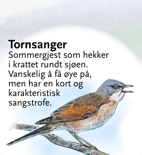
Tornsanger Sommergjest som hekker i krattet rundt sjøen. Vanskelig å få øye på, men har en kort og karakteristisk sangstrofe.