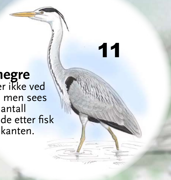
Gråhegre Hekker ikke ved sjøen, men sees i små antall jaktende etter fisk i vannkanten.