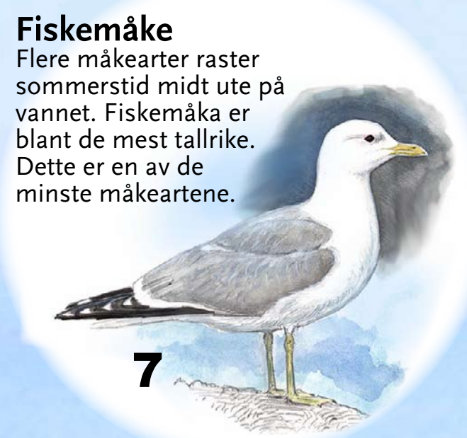
Fiskemåke Flere måkearter raster sommerstid midt ute på vannet. Fiskemåke er blant de mest tallrike. Dette er en av de minste måkeartene.