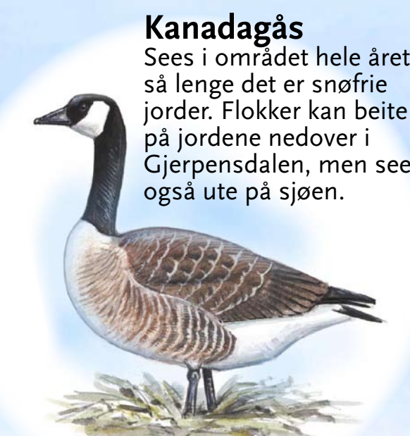
Kanadagås Sees i området hele året så lenge det er snøfrie jorder. Flokker kan bite på jordene nedover i Gjerpensdalen, men sees også ute på sjøen.