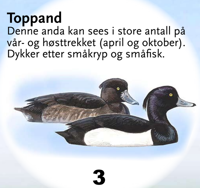
Toppand Denne anda kan sees i store antall på vår- og høsttrekket (april og oktober). Dykker etter småkryp og småfisk.