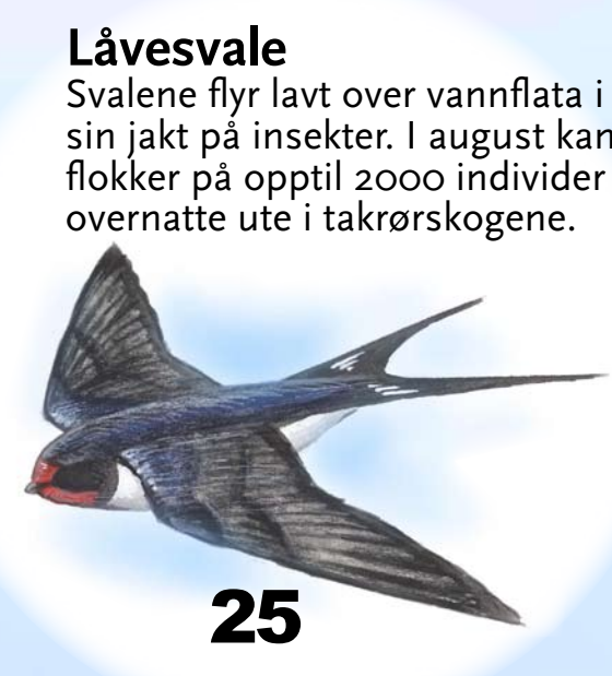
Låvesvale Svalene flyr lavt over vannflata i sin jakt på insekter. I august kan flokker på opptil 2000 individer overnatte ute i takrørskogene.