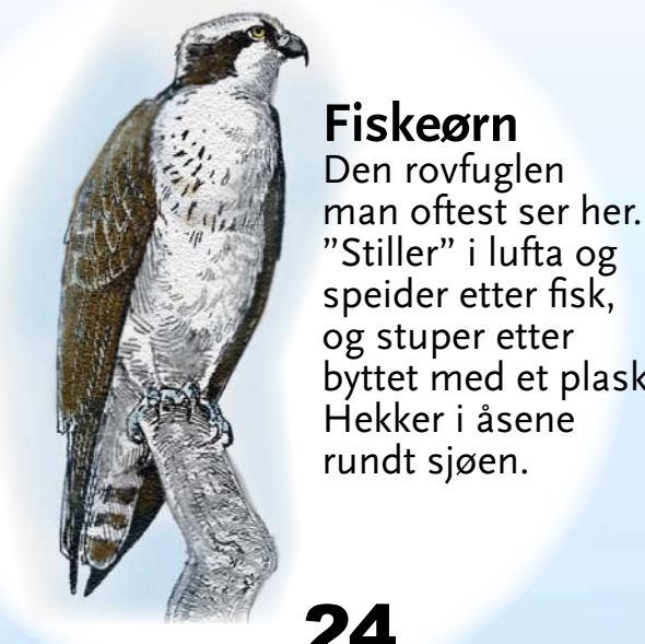
Fiskeørn Den rovfuglen man oftest ser her. "Stiller" i luften og speider etter fisk, og stuper etter byttet med et plask! Hekker i åsene rundt sjøen.

Småillustrasjonene er plassert i det miljøet de forskjellige artene oftest sees i.