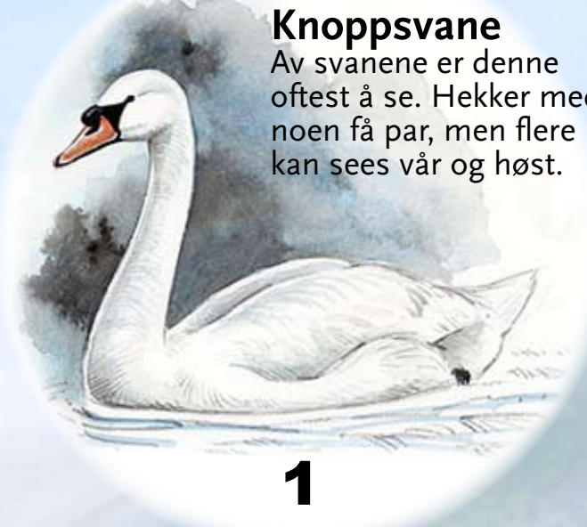
Knoppsvane Av svanene er denne oftest å se. Hekker med noen få par, men flere kan sees vår og høst.