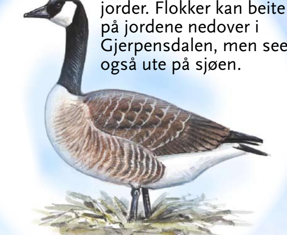
Kanadagås Sees i området hele året så lenge det er snøfrie jorder. Flokker kan bite på jordene nedover i Gjerpensdalen, men sees også ute på sjøen.