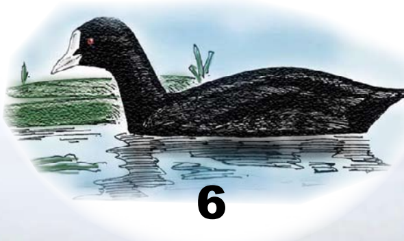
Sothøne Ser ut som en and, men er det ikke. Mangler svømmehud mellom tærne. Hekker fåtallig. Høres ofte; har mange slags skarpe lyder. Dykker etter smådyr og vannplanter.