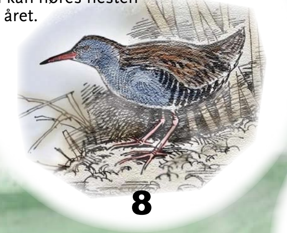
Vannrikse En art som nesten aldri sees, men som høres godt – har en grisehyllikende lyd! Hekker ved sjøen, men kan høres nesten hele året.