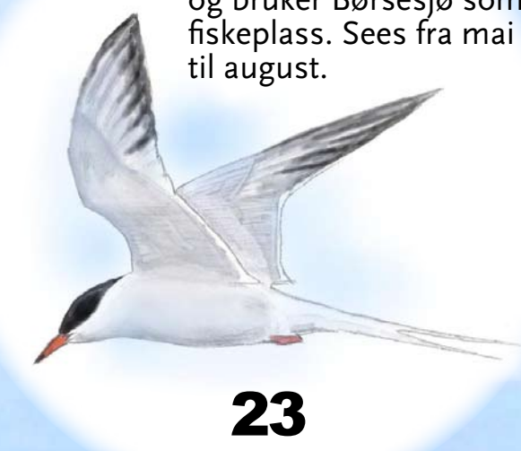
Makrellterne Noen få par hekker i nærheten av Skien sentrum og bruker Børsesjø som fiskeplass. Sees fra mai til august.