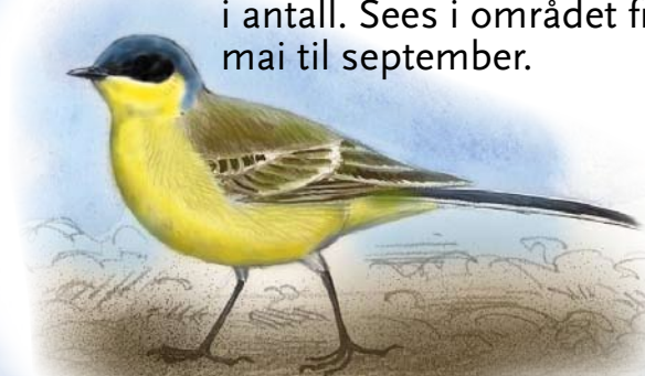
Gulerle Slekting av linerle som hekker i fuktige, lavvokste grasområder slik som beita fukteng. Har gått sterkt tilbake i antall. Sees i området fra mai til september.