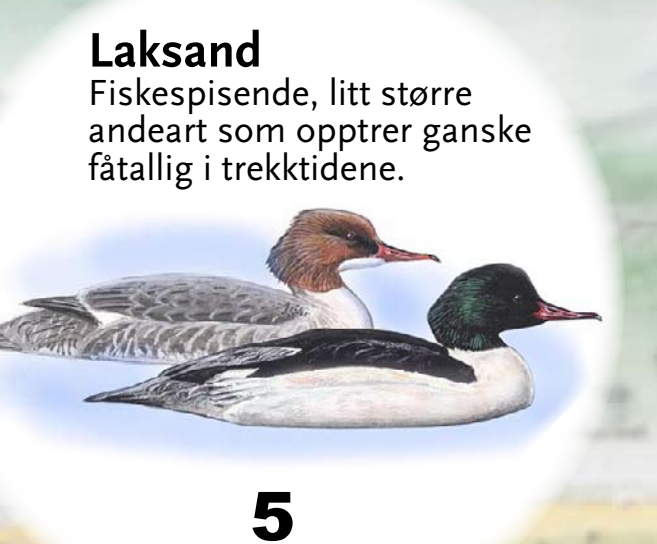
Laksand Fiskespisende, litt større andeart som opptrer ganske fåtallig i trekktidene.