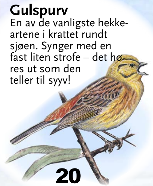
Gulspurv En av de vanligste hekkearterne i krattet rundt sjøen. Synger med en fast liten strofe – det høres ut som den teller til syv!