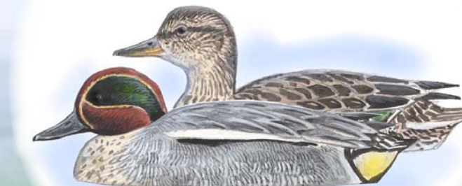
Krikkand Denne lille anda sees mest under trekket, og er en av flere andefugler som bruker den blå borden flittig til næringsøk.