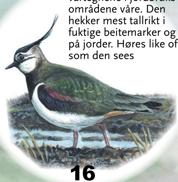
Vipe Et av de første vartegnene i jordbruksområdene våre. Den hekker mest tallrikt i fuktige beitemarker og på jorder. Høres like ofte som den sees