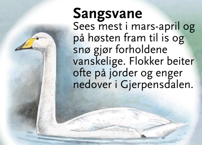
Sangsvane Sees mest i mars-april og på høsten fram til is og snø gjør forholdene vanskelige. Flokker beiter ofte på jorder og enger nedover i Gjerpensdalen.