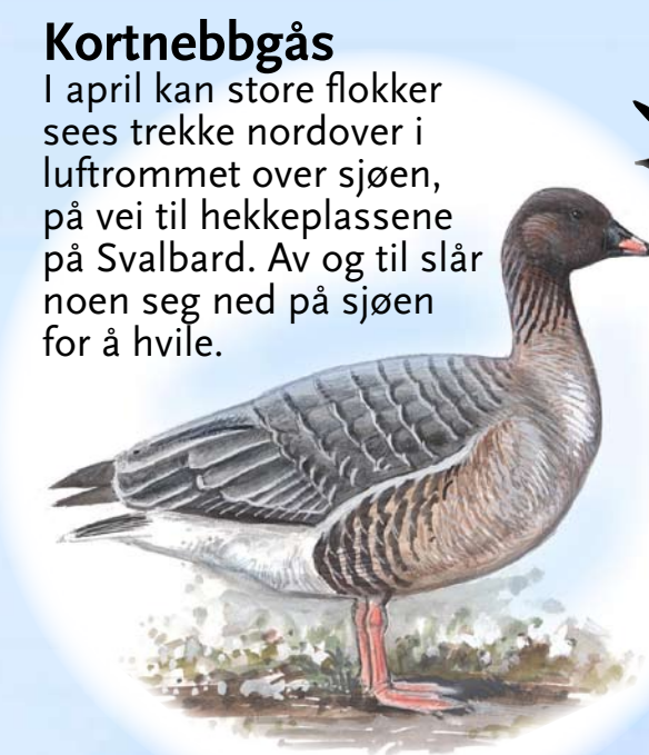
Kortnebbgås I april kan store flokker sees trekke nordover i luftrommet over sjøen, på vei til hekkelassene på Svalbard. Av og til slår noen seg ned på sjøen for å hvile.