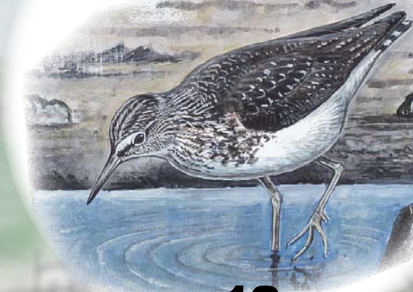
Skogsnipe En av flere vadefugler som bruker den blå borden som matfat under trekket.