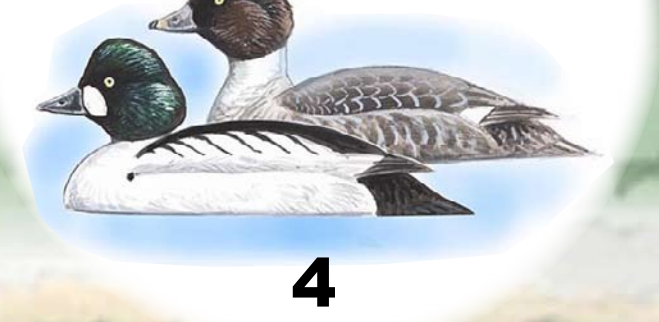
Kvinand Denne dykkanda opptrer på samme måte som toppand, men hekker også i nærområdet til Børsesjø slik at ungekull kan sees på ettersommeren.