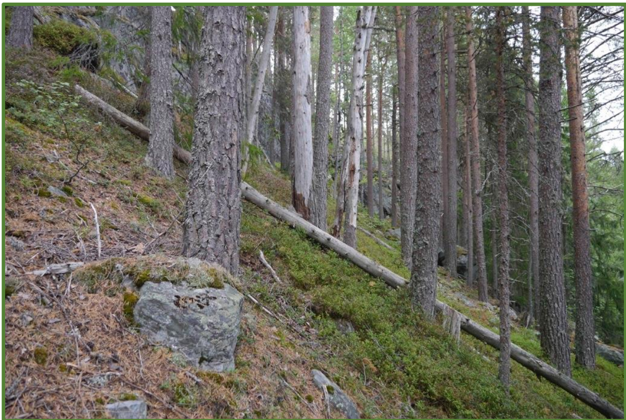
Sørvendt lyngfuruskog med ein del død ved vest i området.

Brynjulvsrud J. G. 2019. Naturverdier for lokalitet Ystesund, registrert i forbindelse med prosjekt Frivilligvern 2018. NARIN faktaark. BioFokus.