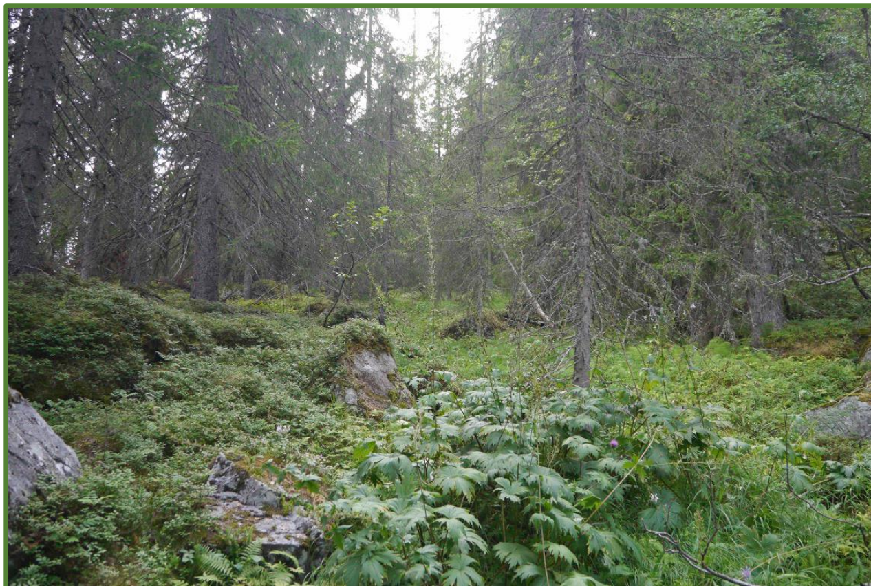
Høgstaudevegetasjon i kjerneområde 2.

Fylkesmannen i Vestfold og Telemark September 2020