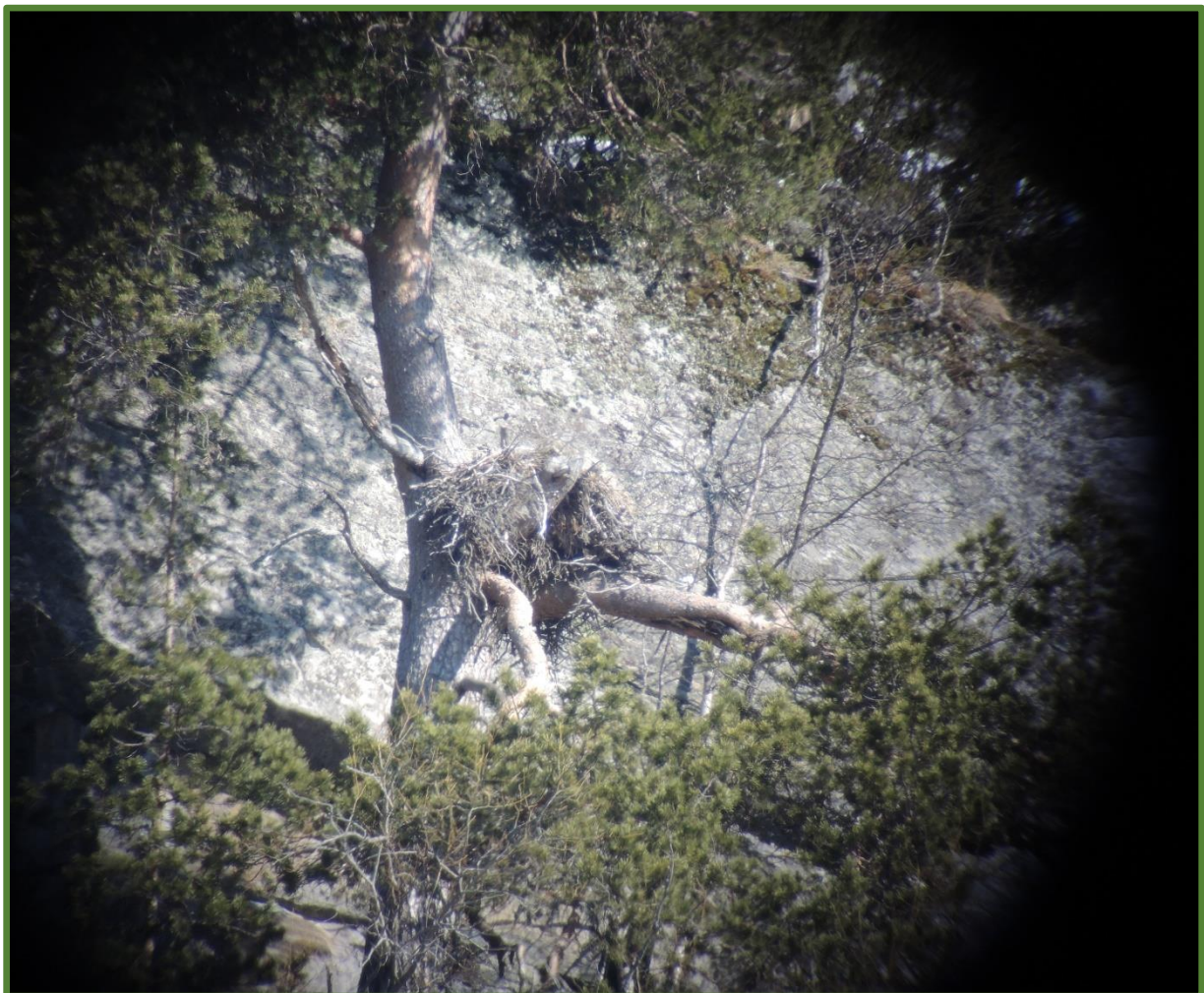
Reir i furu av kongeørn.