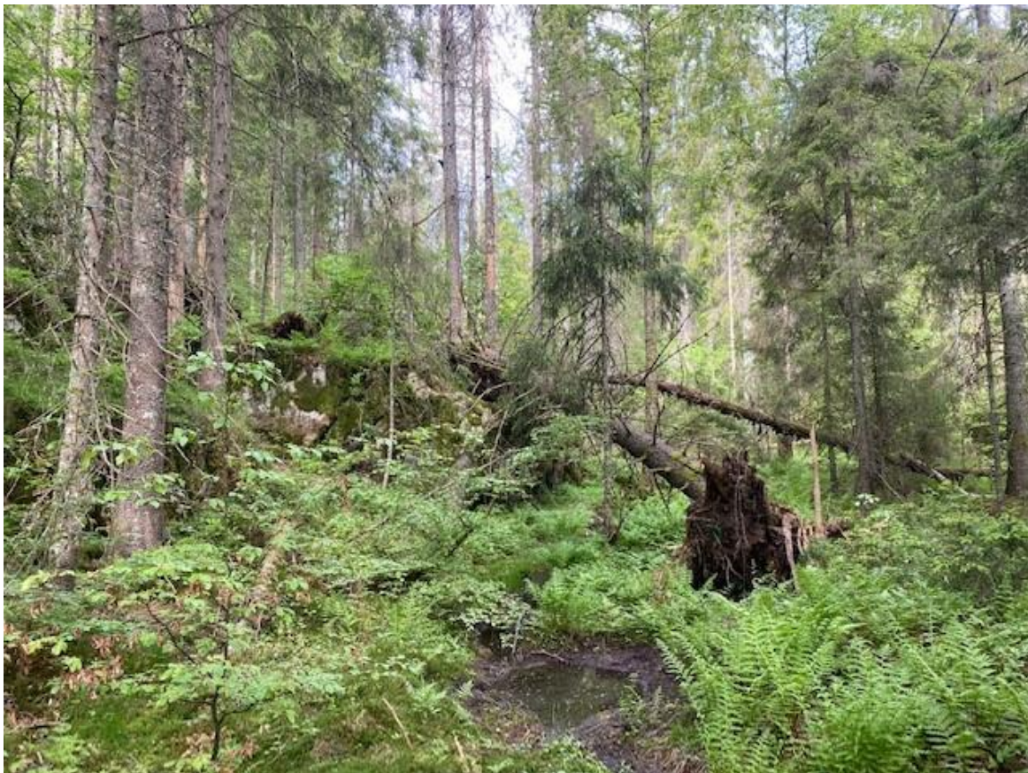
Fuktig, gammel granskog i østre Bakke

Bakke oppfyller de fleste manglene i skogvernet bortsett fra størrelse (jf. Framstad et al. 2017). Hele arealet bidrar til den generelle mangelen hva gjelder lavlandsskog og høyere boniteter. Området oppnår høy grad av mangeloppfyllelse for naturtypene gammel edelløvskog og rik blandingskog i lavlandet. Den totale mangeloppfyllelsen vurderes som høy.