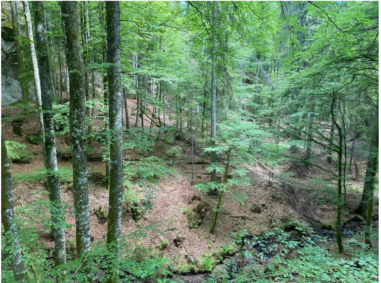
Bøkeskog i Bakke vestre