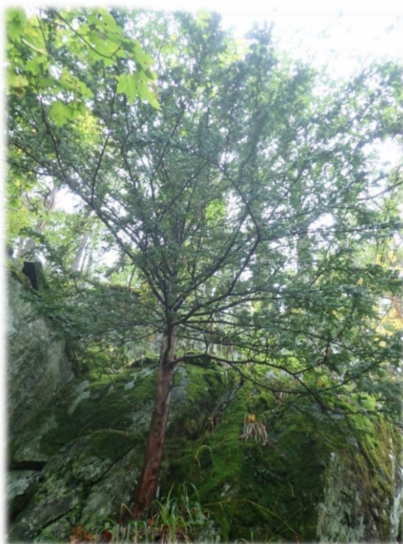
Barlind (VU) innenfor verneforslaget.