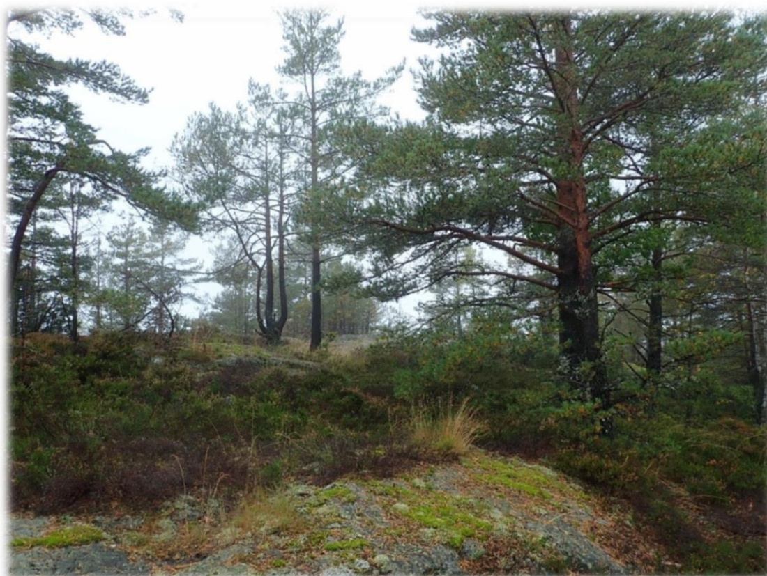
Berglendt mark med furudominans på toppen av Den brente knuten.

Jansson, U. 2020. Naturverdier for lokalitet Barlindknuten, registrert i forbindelse med prosjekt Frivilligvern 2019. NaRIN faktaark. BioFokus.