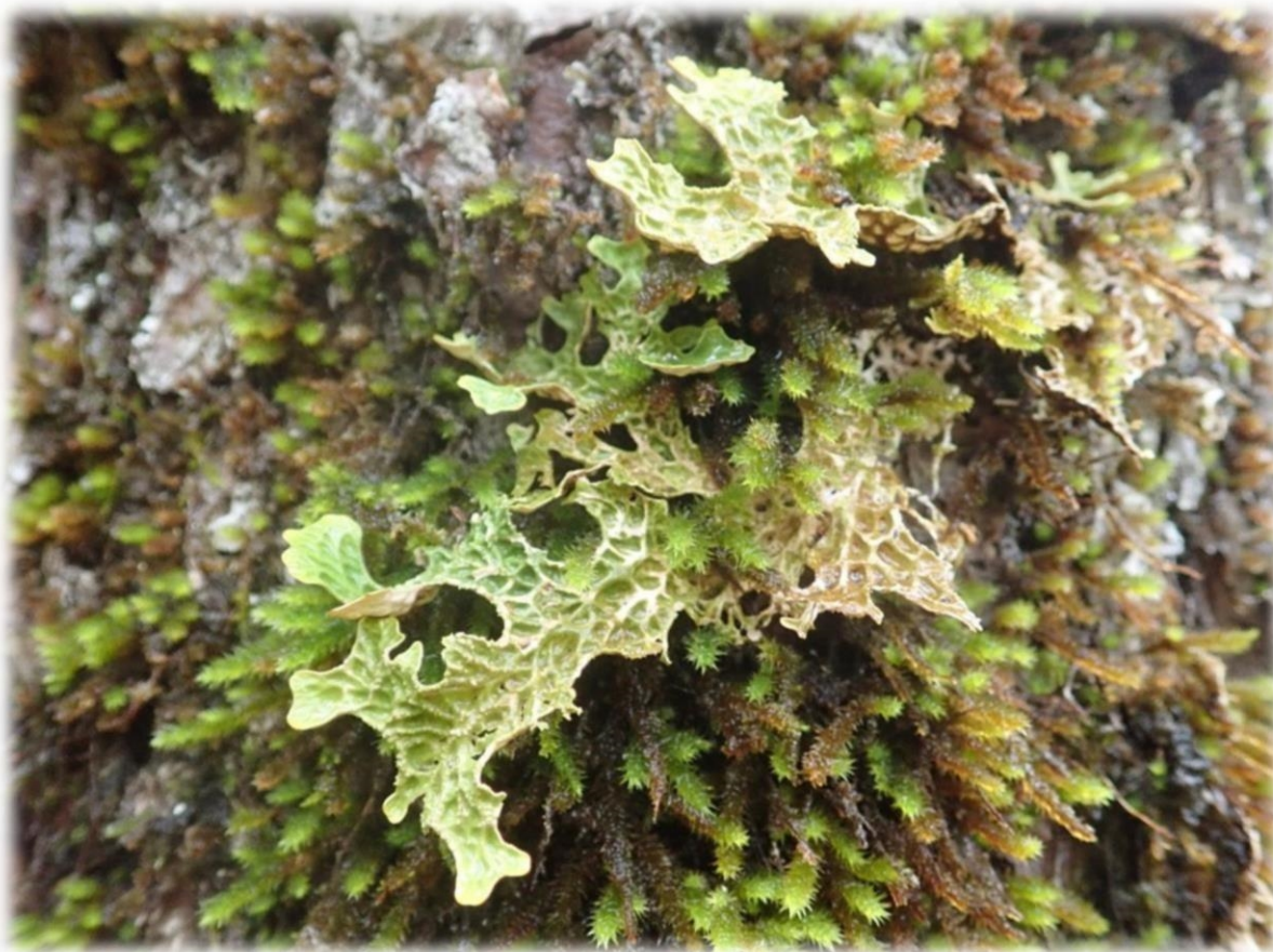
Lungenever på eik i rik edelløvsskog.