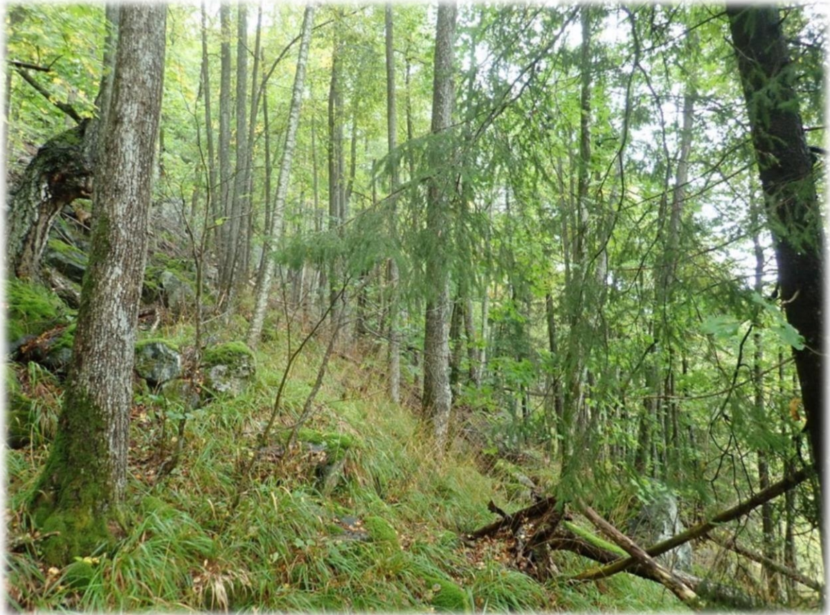
Rik edelløvskog i blokkmark.

Statsforvalteren i Vestfold og Telemark Oktober 2021