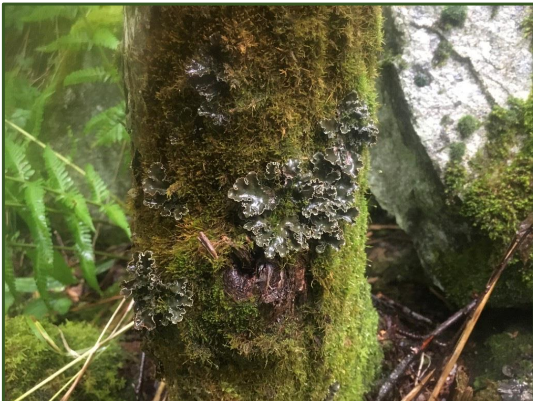
Signalarten kystårenever på alm. Denne forbindes ofte med miljøer med kontinuitet i tresjiktet, samt høy jevn luftfuktighet.