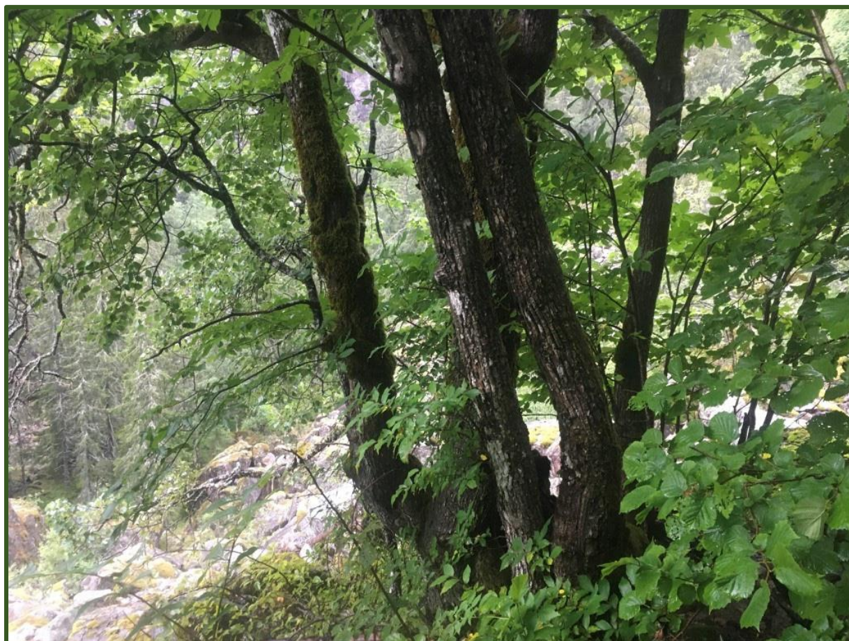
Alm ved Vårkro.

Statsforvaltaren i Vestfold og Telemark September 2023