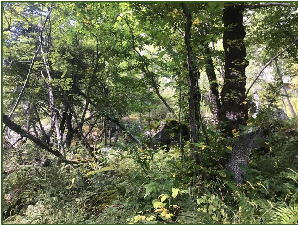
Rasmark-almeskog, noe grove gamle alm og rik vegetasjon