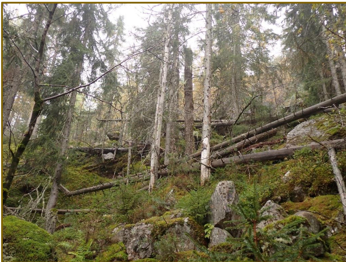
Svært dødved rikt parti med gran ved Hjerpedalen.