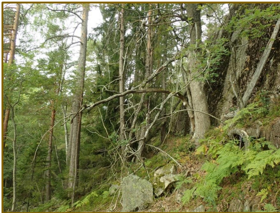
Gammel eik i blandingsskogsmiljø ved Fristjønn NØ.