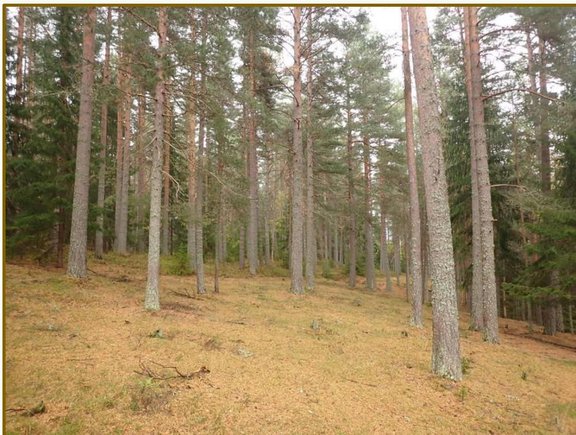
Et parti i sandfuruskogen ved Fjosmo.

Statsforvalteren i Vestfold og Telemark Januar 2022