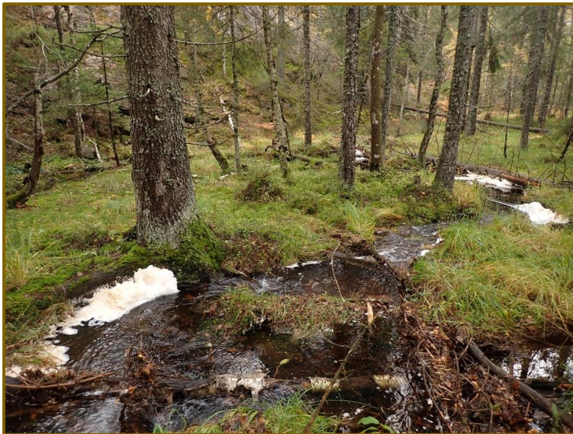
Rik sumpskog med gran og svartor langs svakt meandrende bekk ved Hjerpedalen NØ.

Solvang, R. 2021. Naturverdier for lokalitet Husefjell, registrert i forbindelse med prosjekt Frivilligvern 2020. NaRIN faktaark. Asplan Viak