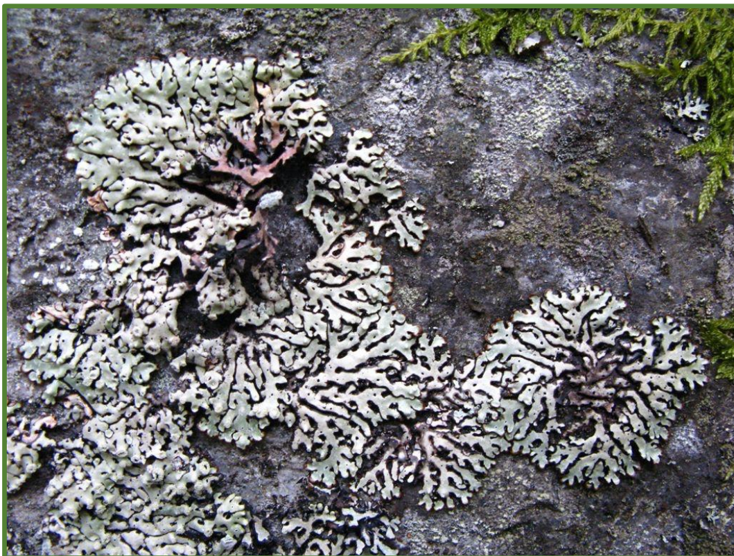
Hodeskodelav Menegazzia terebrata på berg.

http://lager.biofokus.no/omraadebeskrivelser/Bekkekloefter2008_Hoensegjuvet.pdf