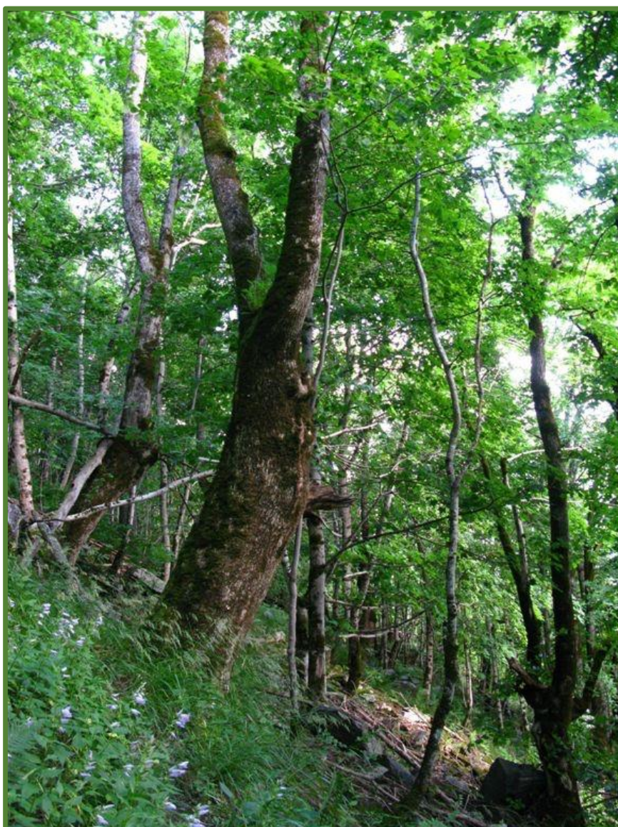
Store naturverdiar er knytt til rik alm-lindeskog. Her er eit parti med gamle styva almetre langs den gamle setervegen.

Statsforvaltaren i Vestfold og Telemark Januar 2022