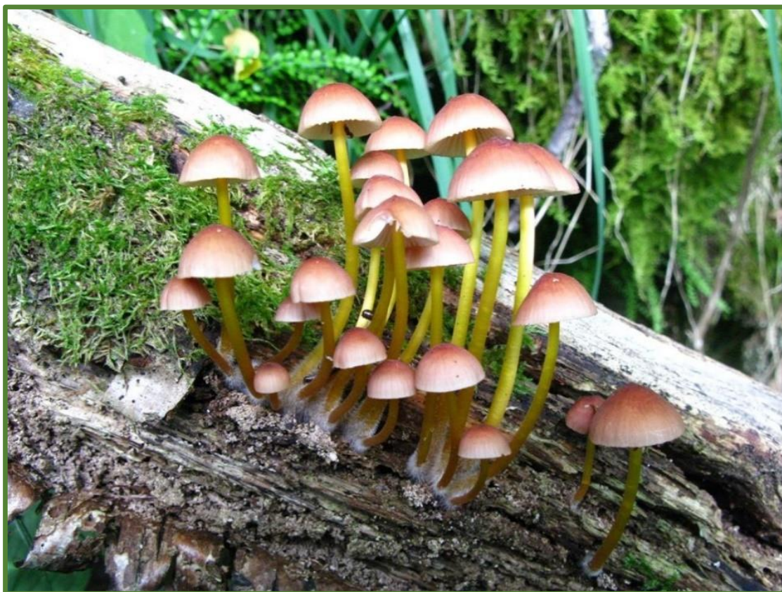
Prydhette Mycena renati veks på daud ved av lauvtre i rikt miljø.

Det er vanleg at det er opna for brenning av bål i store reservat (grense på om lag 700-1000 daa). Ein må då nytte tørrkvist eller ved ein har med seg, ein kan ikkje felle eller hogge opp daude tre.