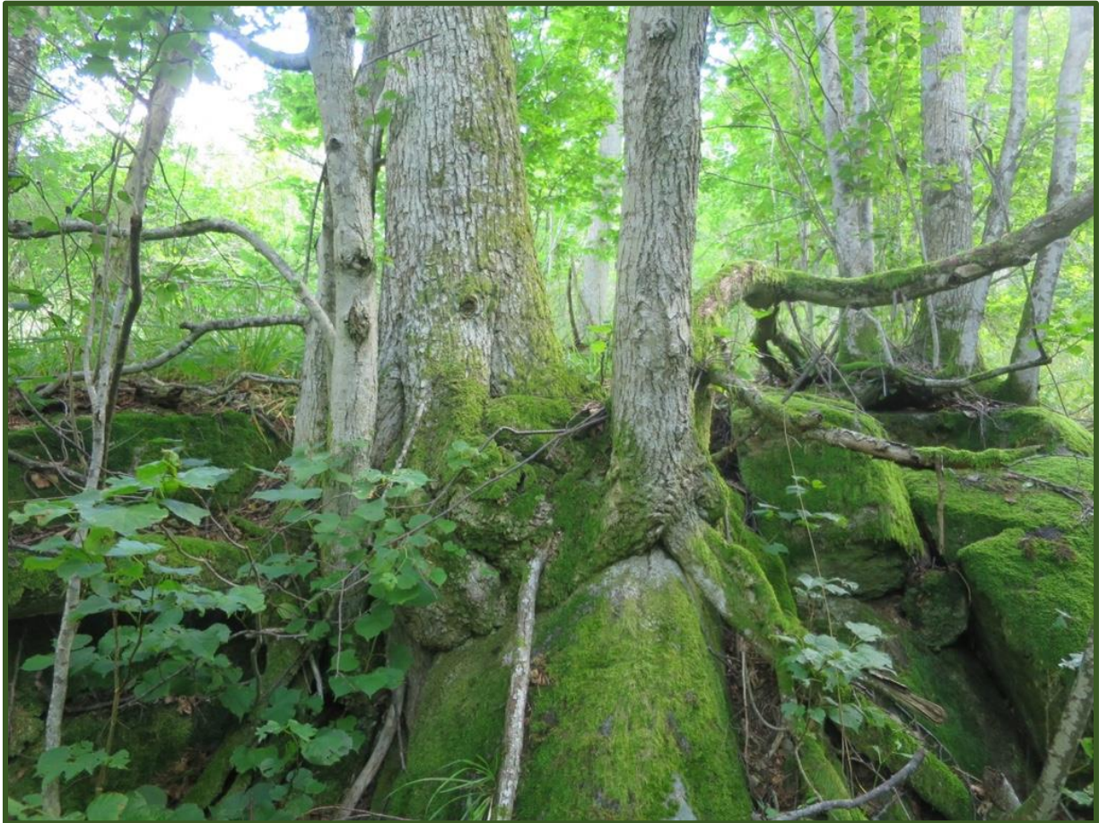
Gammel lindeskog med innslag av noe gammel eik på blokkmark.