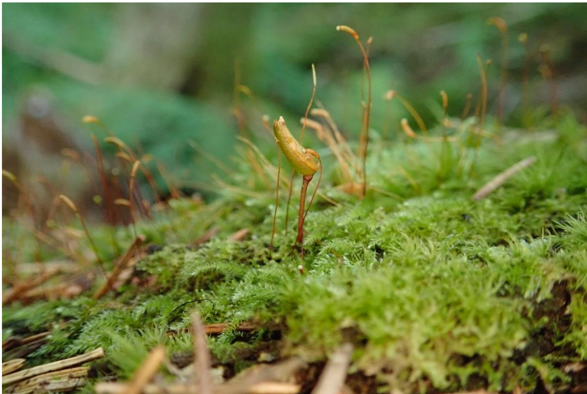
Grønnsko og stubbefauskmose på morken ved.

Heggeneset blir vurdert samla å vera nasjonalt verneverdig (**). Området Heggeneset oppnår høg mangeloppfylling på naturtypar som følgje av over 50 daa rik blandingsskog i låglandet og store areal med intakt skogsbekkekløft. Innanfor generelle manglar er det også høg mangeloppfylling fordi området har 250 daa låglandsskog, høgbonitetsskog og biologisk gammal skog. Området Heggeneset oppnår samla høg mangeloppfylling.