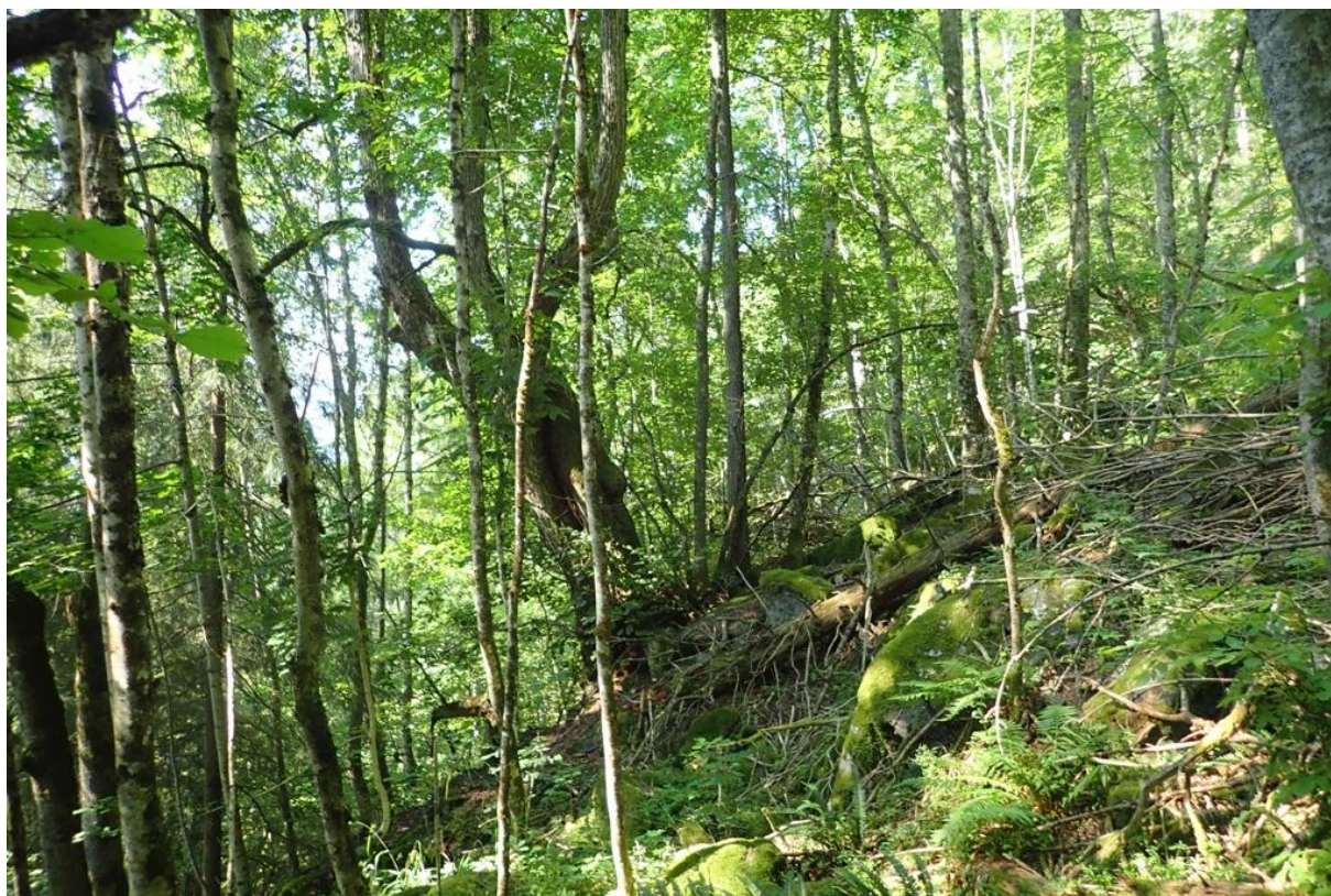
Rik boreonemoral blandingskog i nedre del av området.

Statsforvaltaren i Vestfold og Telemark Juli 2024