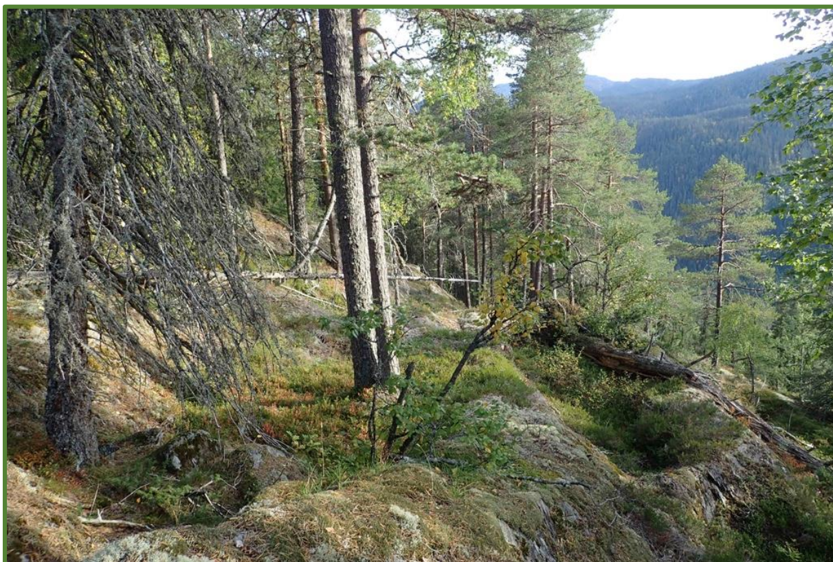
Fleiraldra furuskog i kjerneområde 6.

Brynjulvsrud, J. G. 2021. Naturverdier for lokalitet Storås, registrert i forbindelse med prosjekt Frivilligvern 2020. NaRIN faktaark. BioFokus.