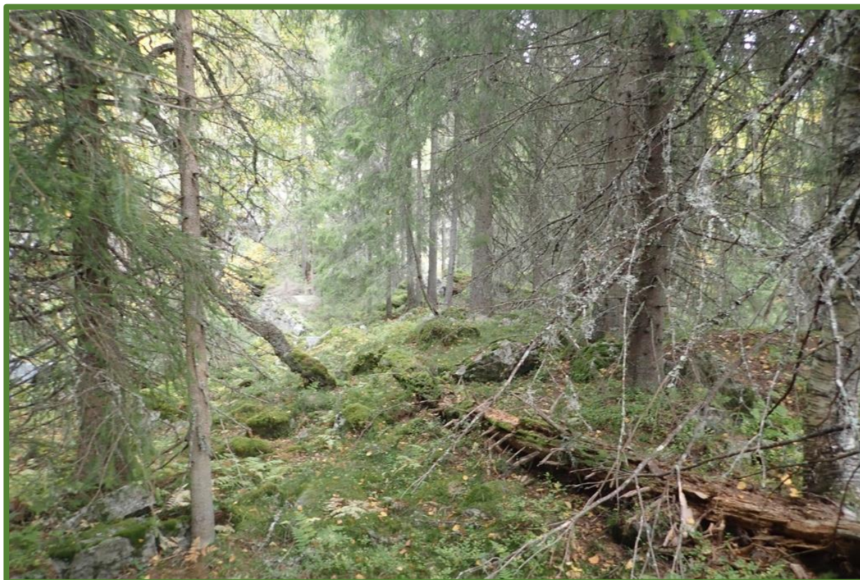
Gammal granskog i kjerneområde 3.

Statsforvaltaren i Vestfold og Telemark Juli 2024