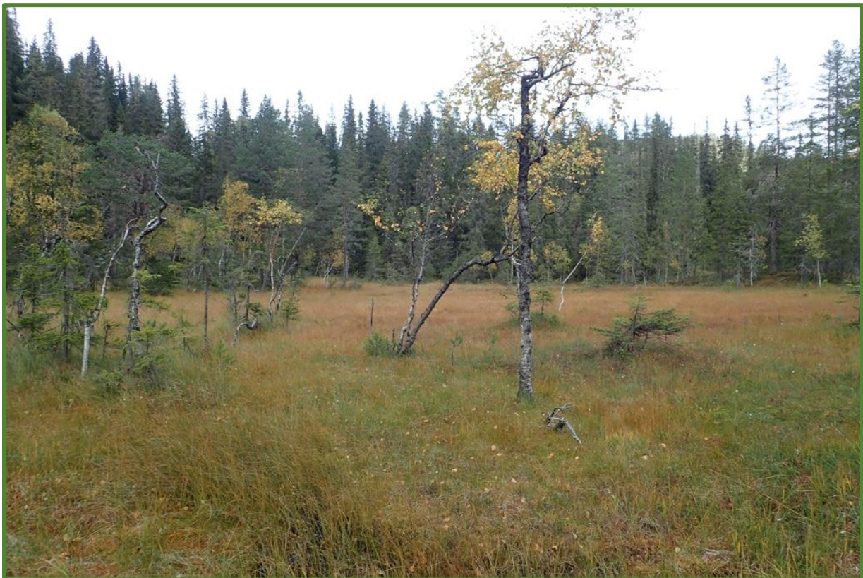
Rikmyr i kjerneområde 4.