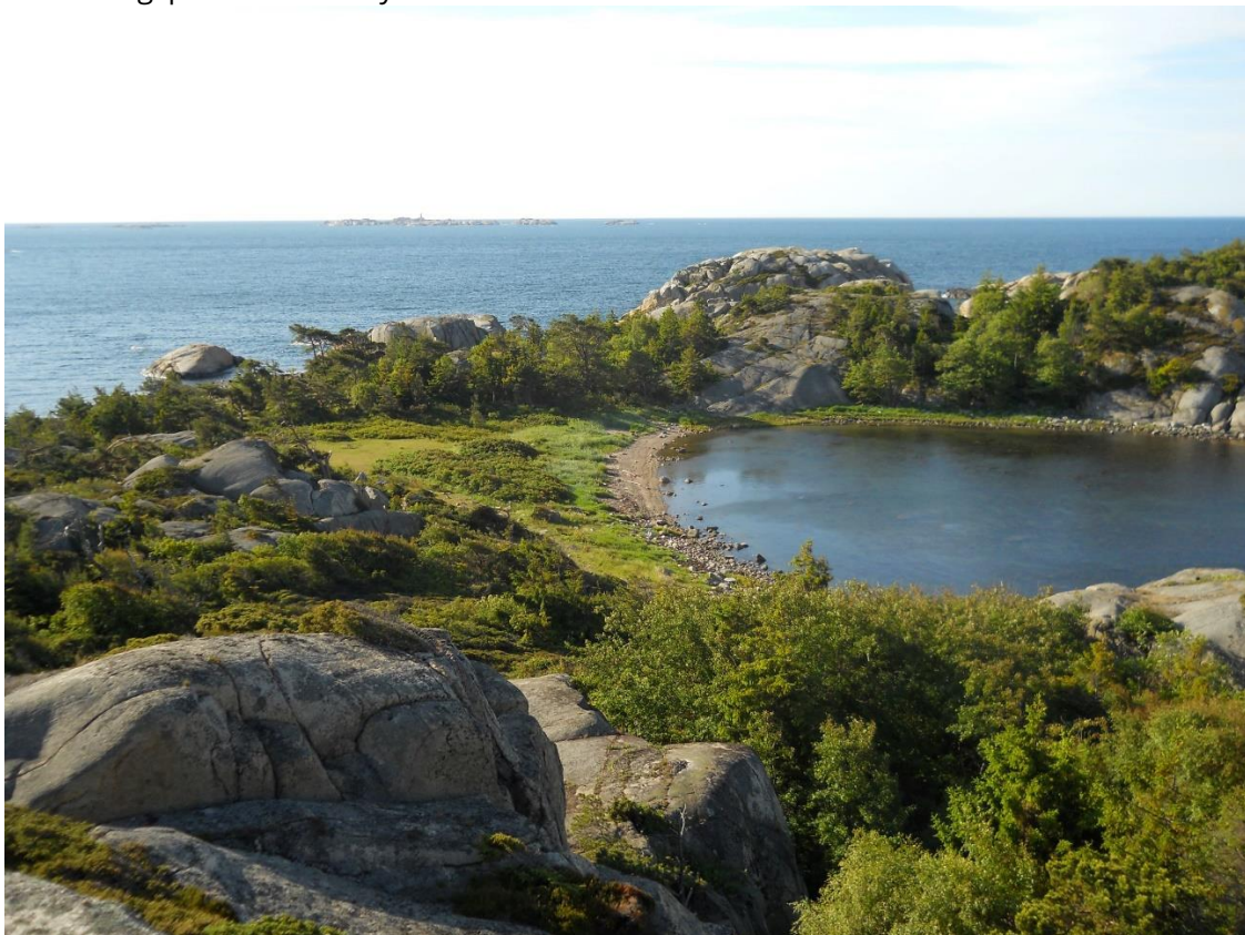
Utsyn mot sør over Flaskebukta.

Statsforvalteren i Vestfold og Telemark vil med dette melde om oppstart av arbeidet med forvaltningsplan for Malmøya naturreservat i Larvik kommune.