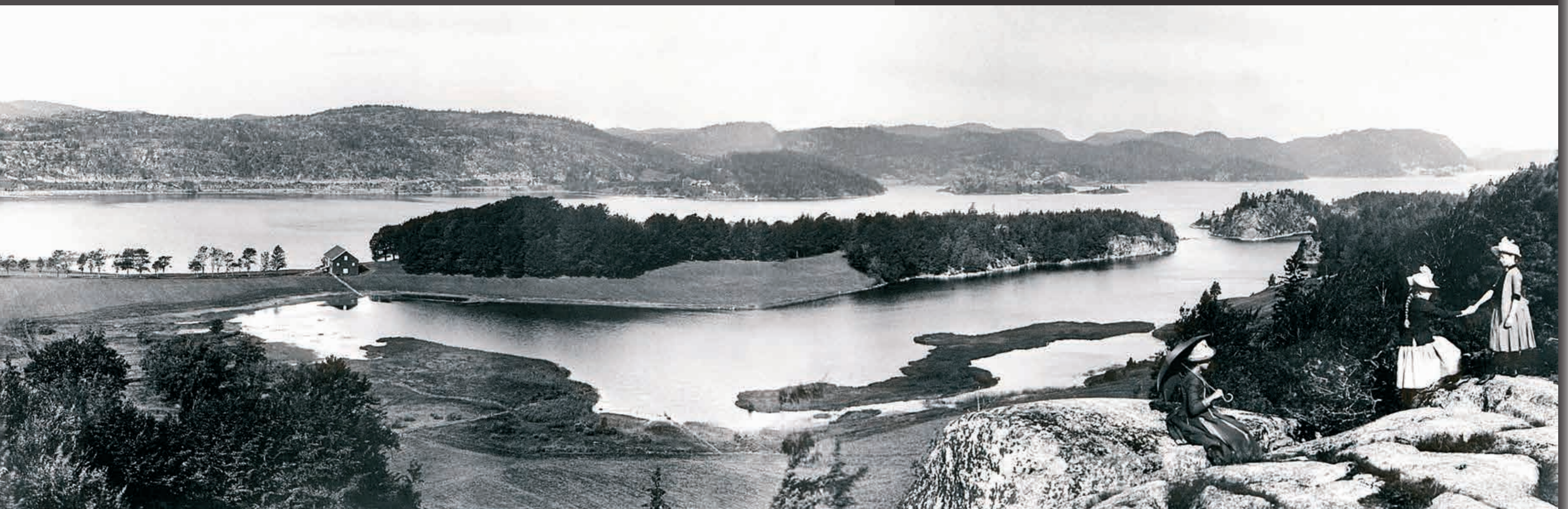
Fra Utsikten over Farrisfjorden med "den røde læ". (Foto: Per Nyhus lokalhistoriske samling).