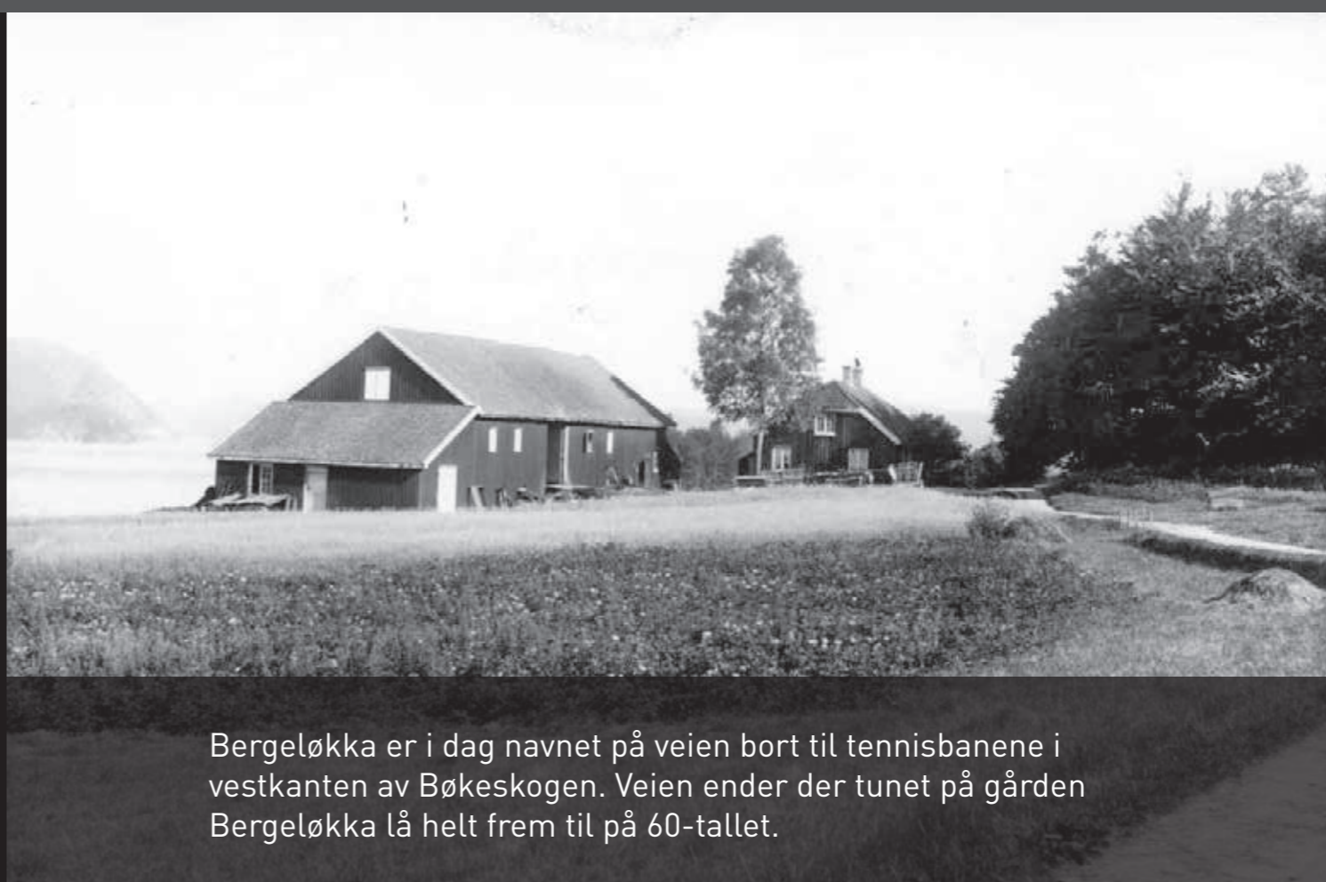
Bergeløkka er i dag navnet på veien bort til tennisbanene i vestkanten av Bøkeskogen. Veien ender der tunet på gården Bergeløkka lå helt frem til på 60-tallet.

In 1980, the forest was designated a natural conservancy area and in 2006, it was included in the UNESCO Gea Norvegica Geopark. The Beech Forest is central to Larvik's public life. It is a natural gathering place every 17th May, on Norway's Constitution Day, but also on Emigrant Day (Whit Sunday) when people who have left the city return to talk about the old days.