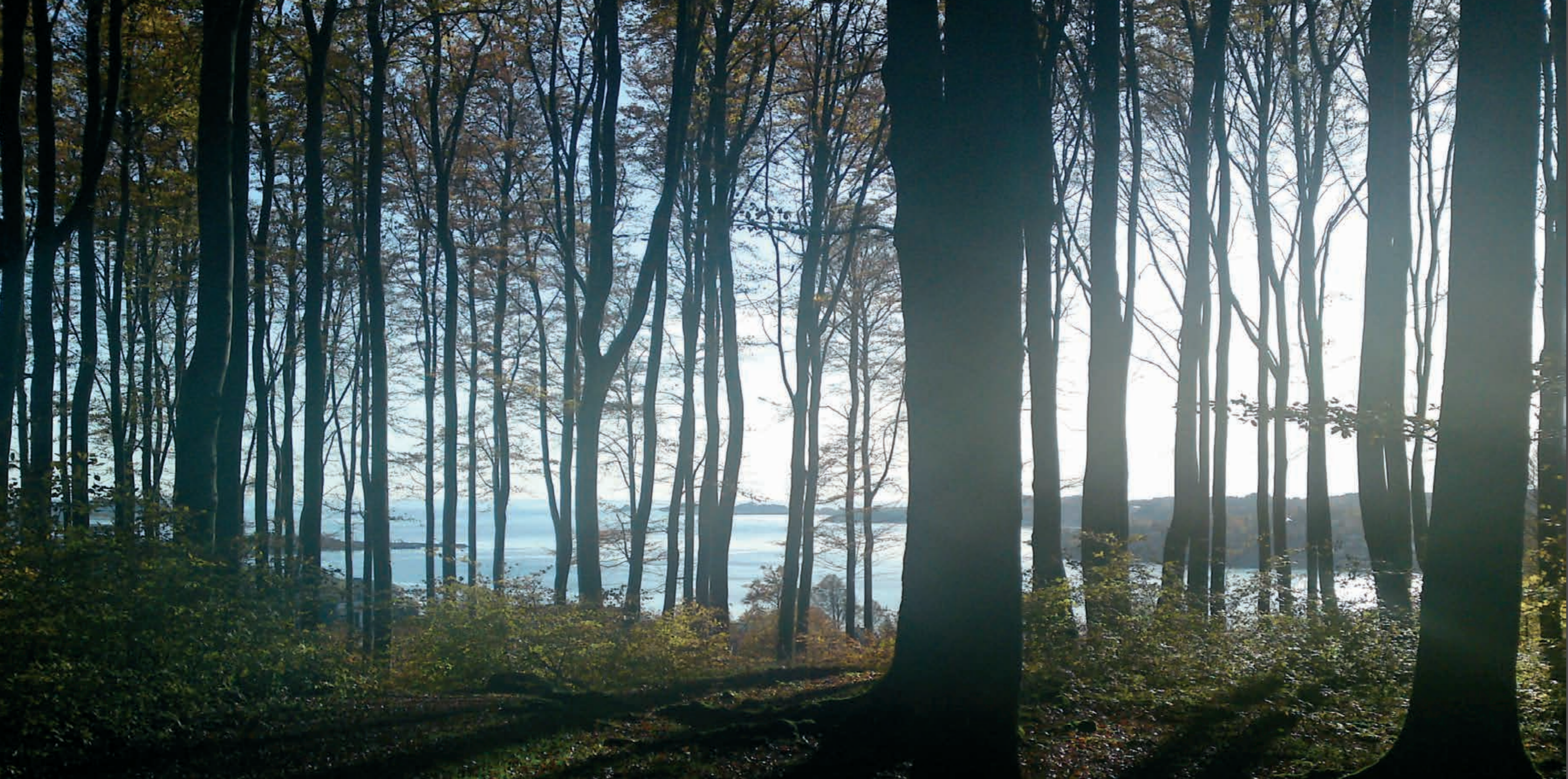
Utsikt over Larviksfjorden fra Bøkeskogen.