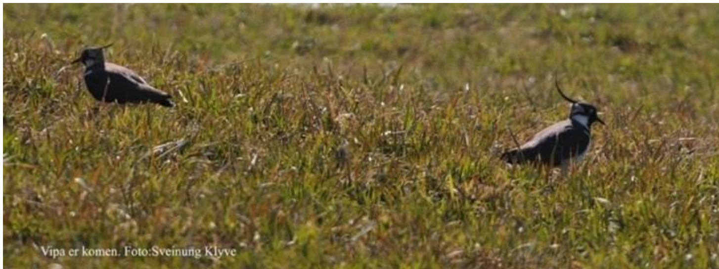
Vipa er komen.