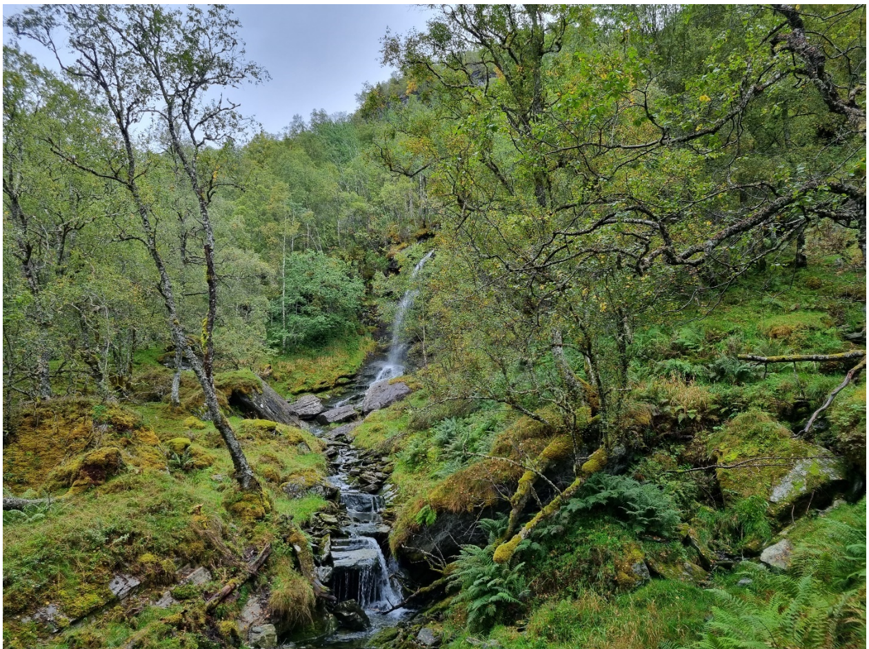
Figur 1 Det er stor variasjon i landskapet langs tilbudsområdet sør og aust for Eimhjellevatnet ned mot kommunegrensa mot Kinn. Fleire bekker renn gjennom området frå fjellet og mot vatnet. Arealet ligg i sterk oseanisk seksjon, som indikerer at det er høg humiditet eller vassmetting i lufta. Fuktig havluft kjem inn over land og vatnet blir "slept" når skyene blir avkjølt i møtet med høge fjell.

Kandidatområdet Eimhjellen ligg mellom Nordfjord og Sunnfjord i Vestland fylke. Det føreslegne naturreservatet er lokalisert i ei nordvendt li som strekk seg frå Krokstadvatnet over Lonene og langs Storfjorden/Endestadvatnet i det sørvestlege hjørnet av Gloppen kommune. Det er eit stort og samanhengande areal i sørboreal og mellomboreal sone, plassert i sterk oseanisk seksjon. Berggrunnen består av næringsrike berg som metasandstein og glimmerskifer, og eit belte av fylitt. Området er eksponert for vind og vêr, og det renner fleire bekker og elver i lisida.