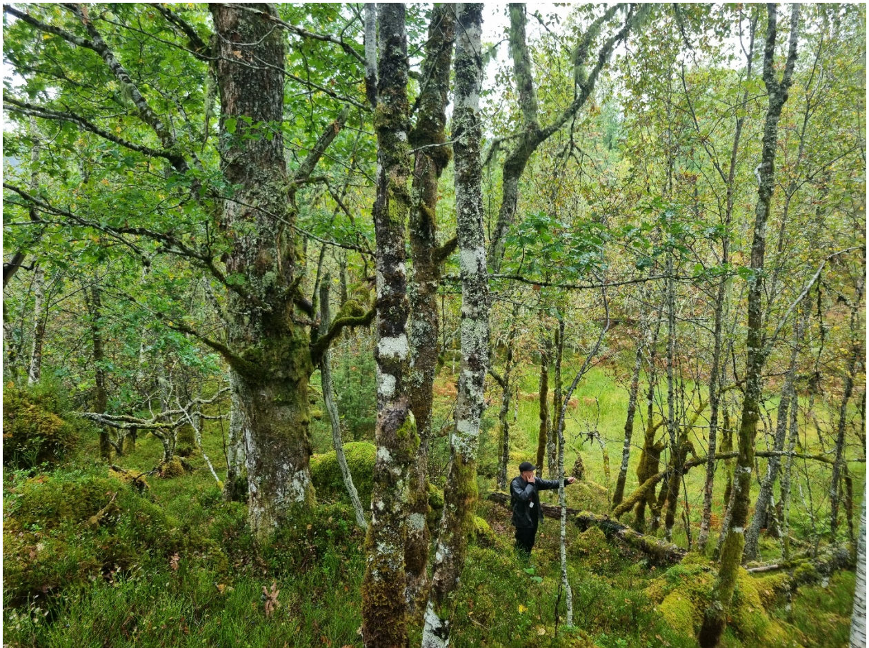
Figur 2 Eimhjellen er eit nasjonalt verdifullt naturområde som både husar regnskog og rik edellauvskog. Her trivst artar som er uvanleg sjeldne, som til dømes den kritisk truga nipdraugmosen. Den trivst berre her og eit fåtalls andre stader som i Skottland og i Himalaya.

som til dømes nipdraugmosen (EN, sterkt truga på den norske raudlista), som vart oppdaga og skildra første gang her av E. Jørgensen i 1902. Huldrestry (i same nabolag, i Brandatjørna naturreservat) vart oppdaga ny for Vestlandet av Kavli i 1970. Eimhjellen dekker god variasjon av skog med både furu, boreal lauvskog som bjørk og osp, samt varmekjære treslag som eik og alm med god aldersvariasjon. Gjennomgåande har området fleirsjiktige eldre skog, det er stadvis storvaksen og grov skog, samt område med gadd og lægder. Området er i stor grad urørt. Sjølv om det er fattig furuskog som dominerer er det også lauvskog, med både boreal utforming og enkelte bestandar av varmekjære treslag av eik og alm, særleg i austre delar av kartleggingsområdet. Eimhjellen dekker både raudlista artar og raudlista naturtypar. Det er store areal av boreal regnskog med furu, samt fattig boreonemoral regnskog i dei nedre delar av lisidene. Også rik og gamal edellauvskog er registrert innanfor oppstartsarealet som t.d. gamal almeskog. Innanfor tilbodsområdet er det registrert 13 ulike raudlista artar, mellom andre nipdraugmose (EN) og kystkantlav (EN). Nipdraugmose ( du kan lese meir ved å følgje denne lenkja ) har både nasjonal og internasjonal interesse, og andre artar er regionalt sjeldne. Det er eit klart potensial for å finne fleire krevjande og raudlista artar.