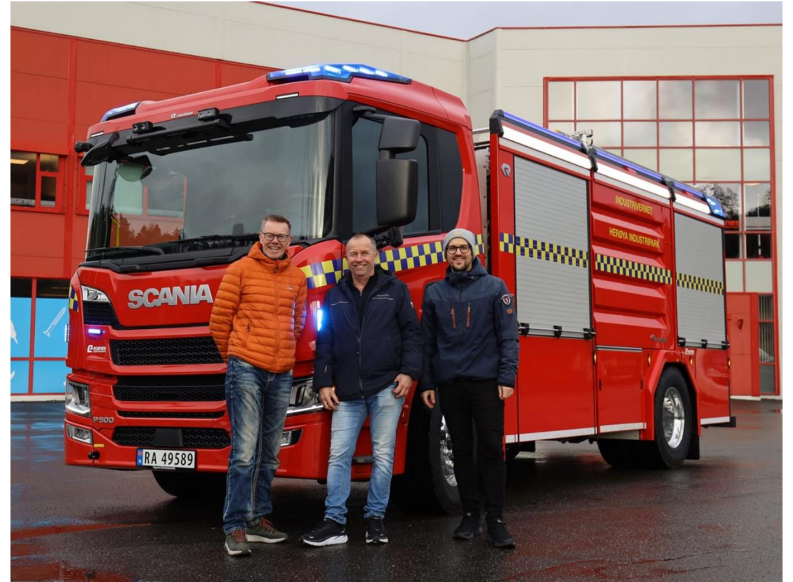
Avarn Security drifter industrivernet i Herøya industripark som en døgnbemannet brannstasjon. I januar overtok de en ny industribrannbil.