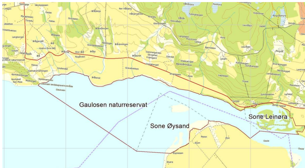
Figur 3: Rød strek markerer vernegrensen for dagens reservat.

Gaulosen naturreservat ble sist revidert 21.11.2016, og består av et område på ca. 2 700 daa, hvorav ca. 2 418 daa er sjøareal.