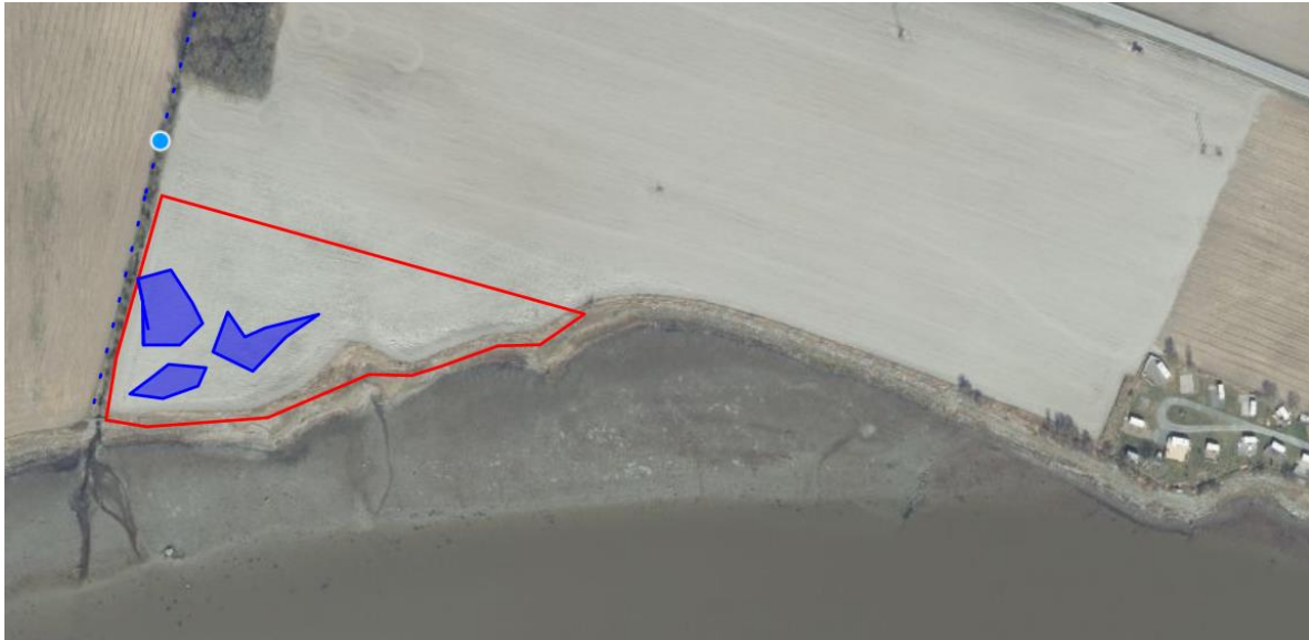
Figur 2: Områdene med blå markeringer ligger lavere enn åkerareal, og er således egnet for å kunne omdannes til vannspeil.

Lokaliteten som foreslås som utvidelse av Gaulosen naturreservat består i dag av dyrka mark men har tidligere vært strandeng/strandsump. Det er planlagt å restaurere lokaliteten tilbake til sin opprinnelige form som strandeng/strandsump etter vernet er vedtatt, figur 2.