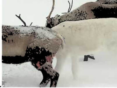
Bildet viser voksen rein med skader etter ulv.

I henhold til St.meld. nr. 15 (2003-2004) og Stortingets behandling av meldingen, skal det ikke finnes ulv i reinbeiteområdene. På tross av dette har vi ulv innenfor distriktet og i reinflokken hvert år. På det verste har vi opplevd at en ulv har drept 27 rein i løpet av et lite døgn (dokumentert.) Våren 2012 fant vi 11 reinkalver drept av ulv i løpet av et døgn (dokumentert av Statens naturoppsyn). I tillegg kommer skadene som ulven gjør gjennom å skape uro i flokken, skremme kalvene i bekker og utfor stup, usynlige bitt og senskader samt kasting av kalv. Disse finner vi sjelden igjen.