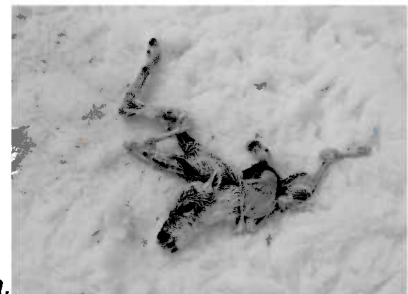
Bildet viser nyfødt reinkalv drept av kongeørn.

Nedenfor vil vi kort gå igjennom hvordan de ulike rovvilt artene påvirker våre rein.