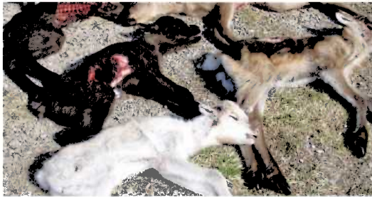
Bildet viser reinkalver drept av ulv.

Ulv og tamrein kan ikke sameksistere på samme geografiske område. Derfor er det særlige behov som må oppfylles dersom Norge skal ha ulv: