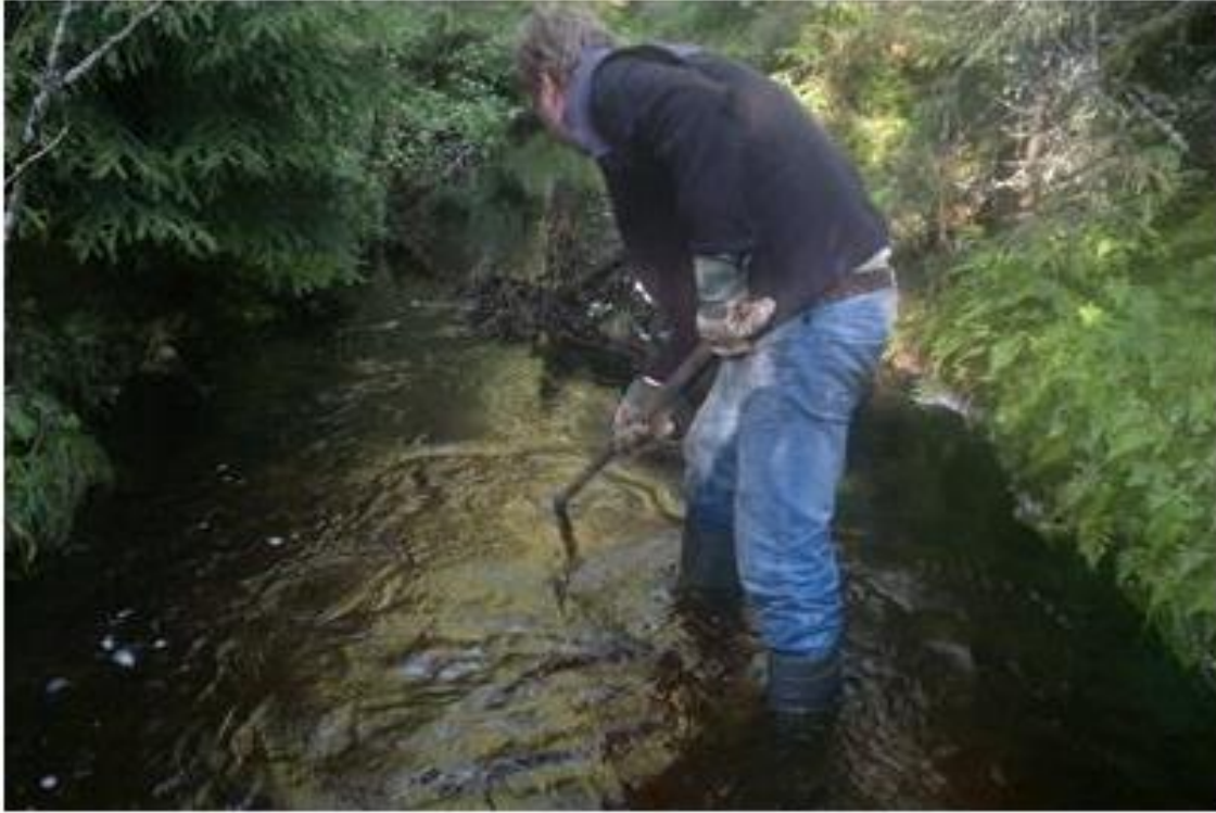
Fra bekkerestaurering i Våler i regi av Våler JFF.