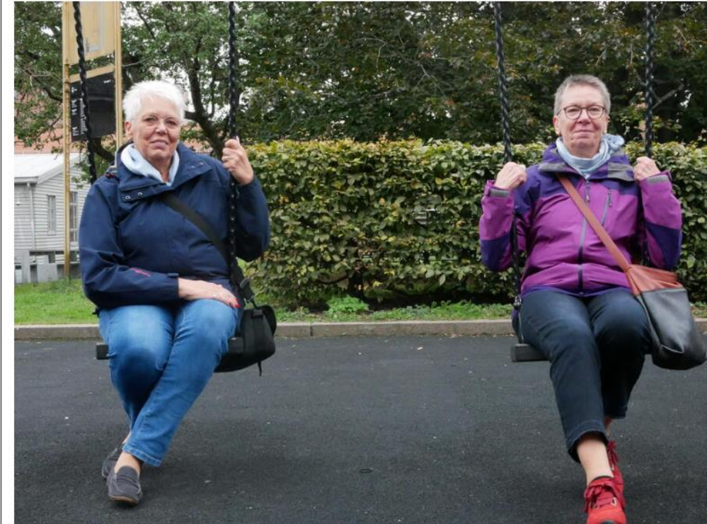
To tyske turister hadde satt seg på huskene i Myntegata i Oslo.

Medvirkning handler om forankring internt i kommunen og blant innbyggerne – gjerne gjennomført i kombinasjon